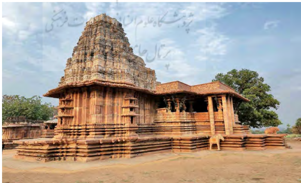
تصویر ۲: «معبد رامپا» ۳۵ نمونه آثار درجه یک کشور هند (سازمان باستان‌شناسی هند، ۲۰۱۹).

- درجه سه: شامل ساختمان‌های مهم برای منظر شهری که ویژگی‌های معماری، زیبایی‌شناختی یا جامعه‌شناختی را برمی‌انگیزد؛ هرچند نه به‌اندازه درجه دو. این آثار به تعیین ویژگی‌های خاص در نماها و یکسان بودن ارتفاع، عرض و مقیاس کمک می‌کنند (Karnataka Town & Country Planning Act, 1961).