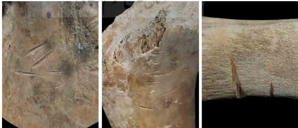
تصویر ۵. آثار برش بر روی نمونه‌ها در زیر میکروسکوپ (نگارندگان، ۱۳۹۹).

پژوهشگاه علوم انسانی و مطالعات فرهنگی سال ۱۳۹۹