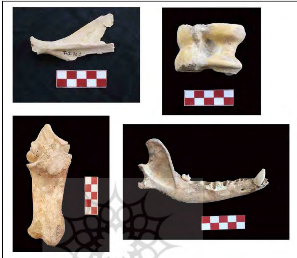
تصویر ۴. تعدادی از نمونه‌های استخوانی محوطه تقی آباد (نگارندگان، ۱۳۹۷).