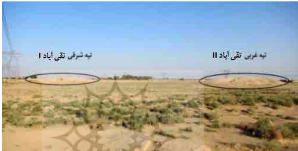
تصویر ۳. نمایی از محوطه دو تپه غربی و شرقی تپه تقی آباد (نگارندکان، ۱۳۹۷).