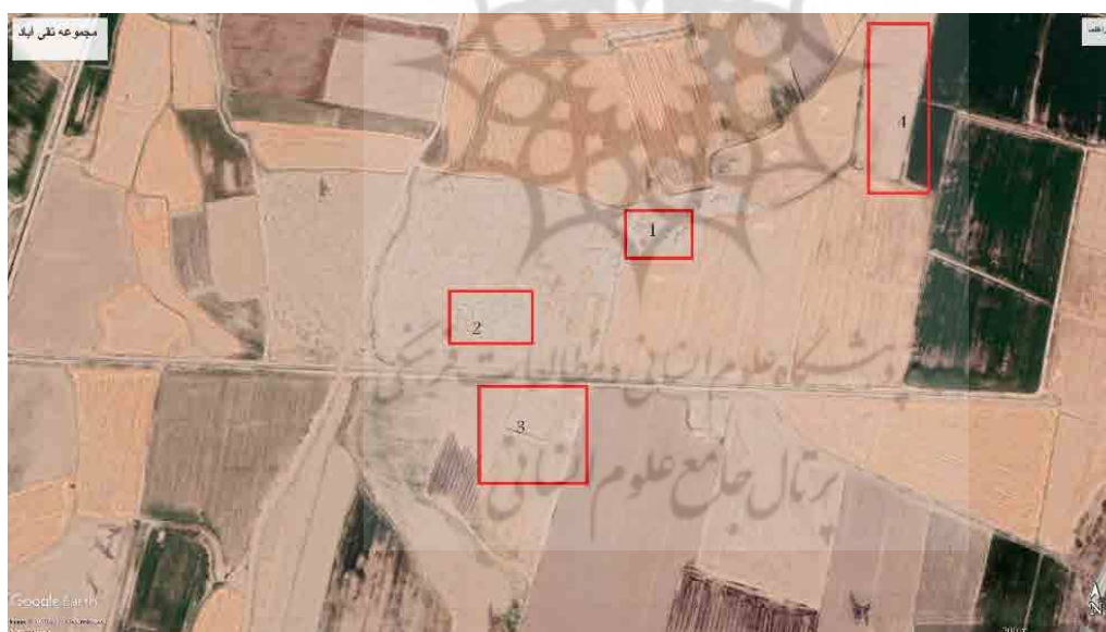
تصویر ۲. موقعیت مجموعه تقی‌آباد نسبت به هم (نگارندگان، ۱۳۹۷).