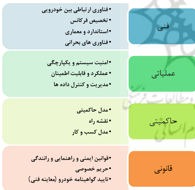
شکل 2: ابعاد چالش‌ها و الزامات فناوری ارتباطات هوشمند خودرویی

شکل شماره 2، ابعاد چالش‌ها و الزامات فناوری ارتباطات هوشمند خودرویی را نشان می‌دهد.