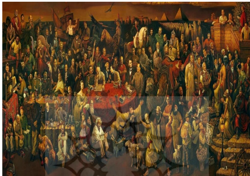
شکل ۱: گفتگویی با داتنه درباره کمدی الهی

پیوند بخش‌های ناسازگار در راستای «ساختار چندآوایی کلاژ» است و نمود «پیوند گفتگویی» ۷۵ میان آنها (۴، ۲۰۲۰: Drag)، و بازتاب انگاره «کارناوال» ۷۶ یا «شادپیمایی» در اندیشه باختین است. باختین باور داشت که «کارناوال»، یا نمود «جشن‌ها و آیین‌های گروهی»، ریشه‌ای ژرف در «ناخودآگاه فردی و گروهی» دارد و «دانش کارناوالی» از دنیا از «سازی آزاد و استوار بر آشنایی پیشین میان آدمیان» پدید می‌آید. «کارناوال» می‌تواند ناشدنی‌ترین پیوندها را در میان آدمیانی که روبرویی آنها با یکدیگر شدنی نیست، نیروبخشیده و گفتگویی آزاد و همبستگی‌آفرین در میان آنها