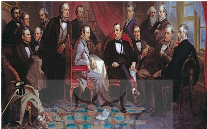
شکل ۲: واشینگتون اروینگ و دوستان فرهیخته‌اش در سانی ساید

آنچه شوسل در گزینش خود انجام داده است آشکارا در ویرایش‌های گوناگون گلچین‌های ادبی جهان همچون نورتون ۸۷ دیده می‌شود. در بررسی این ویرایش‌ها درمی‌یابیم که گاهی نویسنده‌ای که در ویرایشی پیشین شناسانده شده است، در ویرایش پسین دیده نمی‌شود. و یا با شناسایی نویسندگان برجسته هر دوره برخی از نویسندگان برجسته پیشین که کمتر در چارچوب دانشگاهی بررسی می‌شوند از این ویرایش‌ها رانده می‌شوند. در این راستا، به ویژه از سال‌های پایانی سده بیستم و با رشد جهانی شدن، دنیای ادبیات نیز در برجسته‌سازی نوشته‌های پیشین بیشتر تلاش نموده و در تکاپوی شناسایی آنها در ادبیات کشورهای گوناگون است. این دگرگونی در بخش‌های افزون‌شده به گلچین نورتون از شاهکارهای جهان ۸۸ در پایان سده