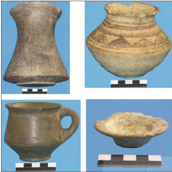
تصویر ۱۳: سفال‌های بدست آمده از قلعه تپه در زمان تسطیح محوطه.