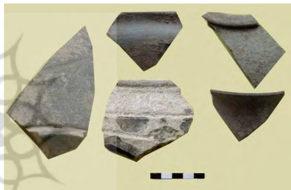
تصویر ۸: نمونه‌ای از سفال‌های خاکستری عصر آهن.