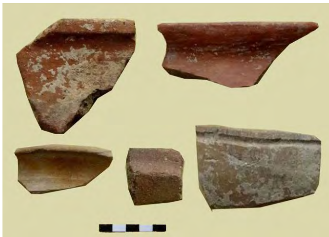
تصویر ۷: سفال‌های قرمز و قهوه‌ای عصر آهن.