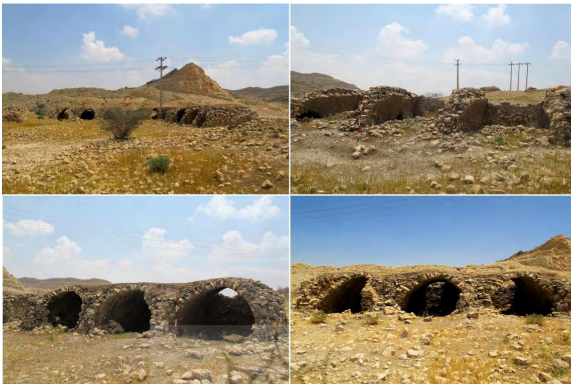
تصویر ۱۵: بخش‌هایی از اتاق‌های نیمه‌سالم در طبقه دوم.