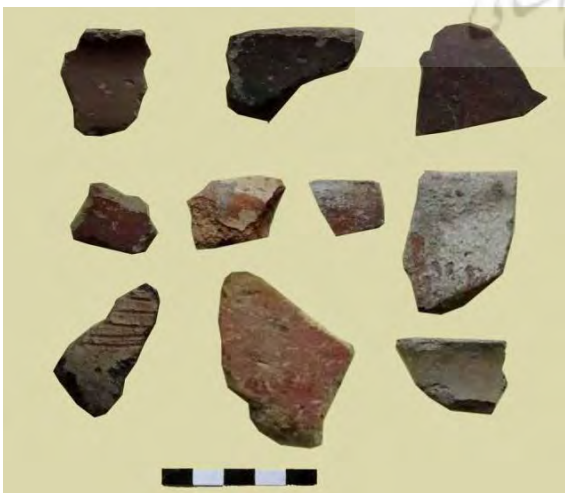
تصویر ۵: سفال‌های ساده و سفال نقش‌کنده دالما.