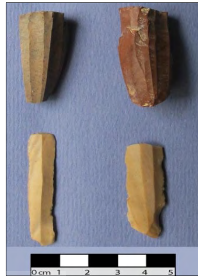
تصویر ۱: سنگ مادر فشنگی، محوطه پیدزرد.