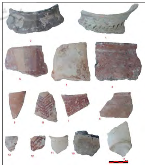
تصویر ۱۰: تصویری بخشی از سفال‌های بدست آمده از بررسی سطحی غار سمنگان.