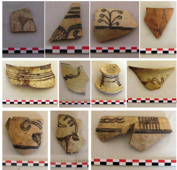
تصویر ۱۲: نمونه‌هایی از سفال‌های دوره مس سنگی جدید تپه سگزرآباد بدست آمده از کاوش‌های سال ۱۳۸۸.