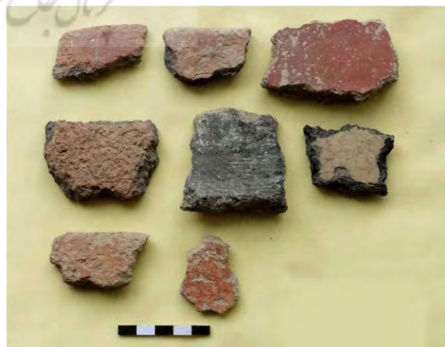
تصویر ۴: نمونه‌ای از سفال‌های ساده دالما.