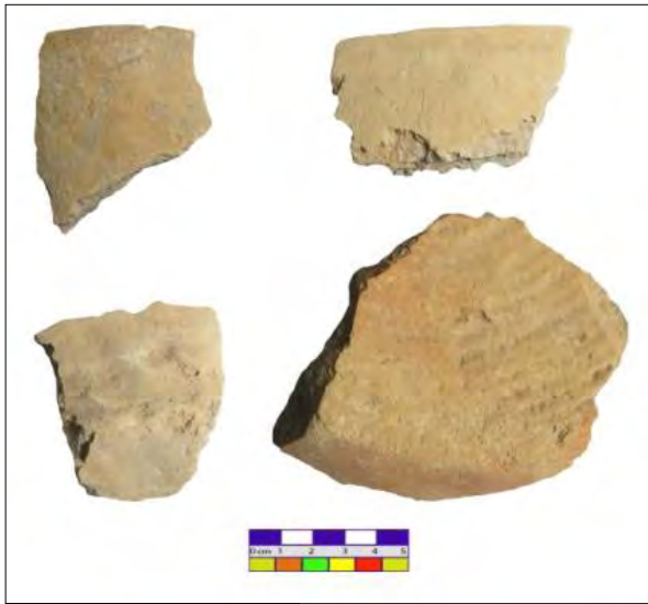
تصویر ۲: سفال‌های منتخب از مجموعه تُل عزیززی.