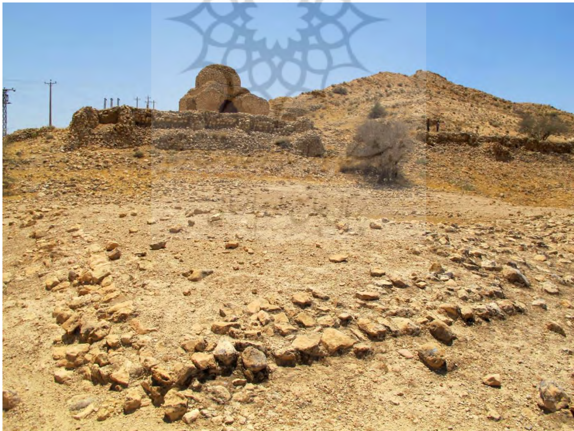
تصویر ۱۴: آثار رج دیوارهای به جا مانده در طبقه نخست.