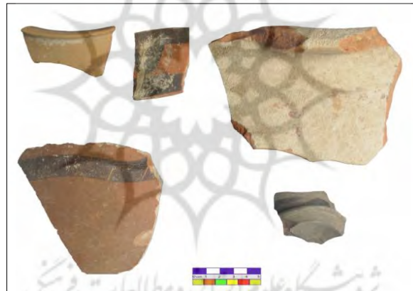
تصویر ۳: سفال‌های منتخب از محوطه دومنه.