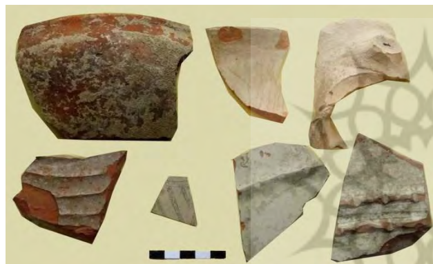
تصویر ۹: سفال نارنجی و نخودی و سفال نقش‌کنده عصر آهن.