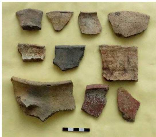
تصویر ۶: نمونه‌هایی از سفال‌های دوره مفرغ منطقه.