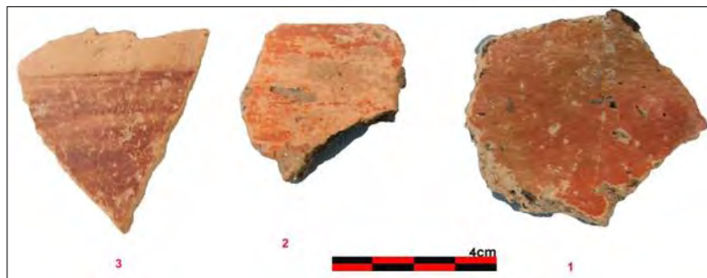
تصویر ۱۱: تصویری از سفال‌های بدست آمده از غار کولان گورا.