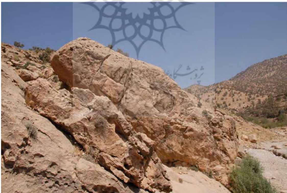
تصویر ۴: موقعیت نقش برجسته آشوری میشخاص بر روی صخره واقع در حاشیه رودخانه میشخاص