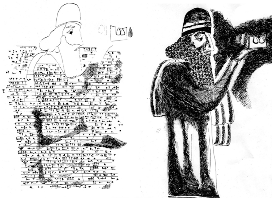
شکل ۱: طرحی از نقش برجسته و کتیبه سارگون دوم در تنگی ور (برگرفته از سرفراز، ۱۳۴۷: شکل های ۳ و ۴).