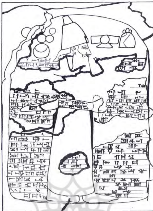
شکل ۲: طرحی از نقش برجسته اشکفت گل گل (برگرفته از مظاهری، ۱۳۸۵: ۷۴).