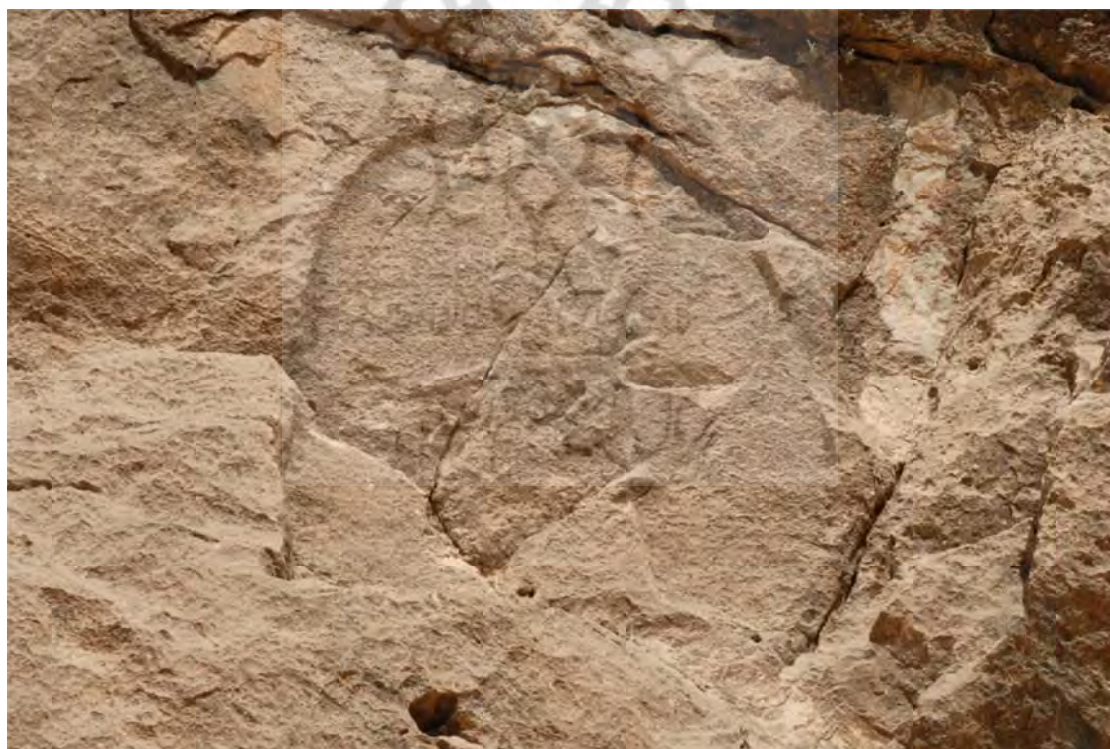
تصویر ۶: نمایی نزدیک از نقش برجسته آشوری میشخاص