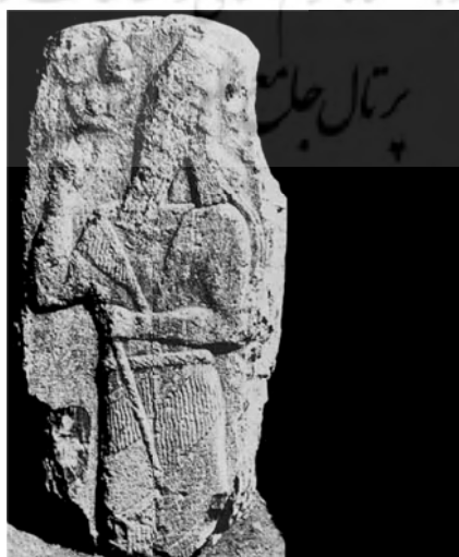
تصویر ۱: سنگ یادمان پیروزی سارگن دوم در نجف آباد اسد آباد (بر گرفته از: Levine, 1971: 43).