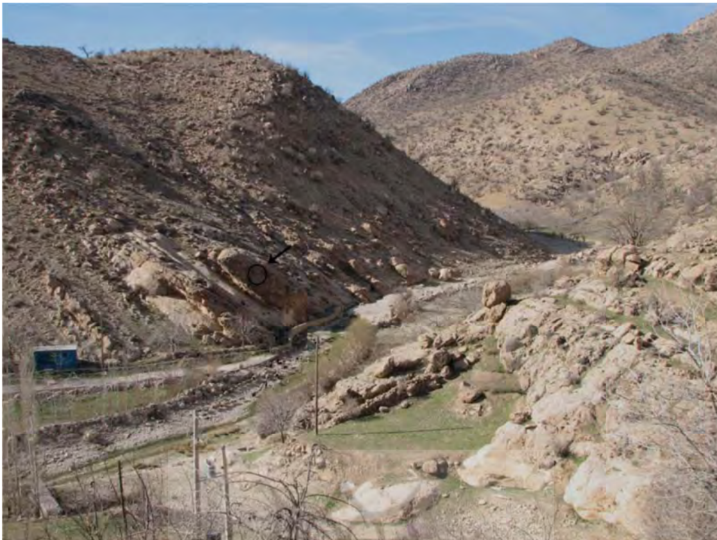
تصویر ۳: دورنمایی از وضعیت قرارگیری نقش برجسته میشخاص نسبت به اطراف.