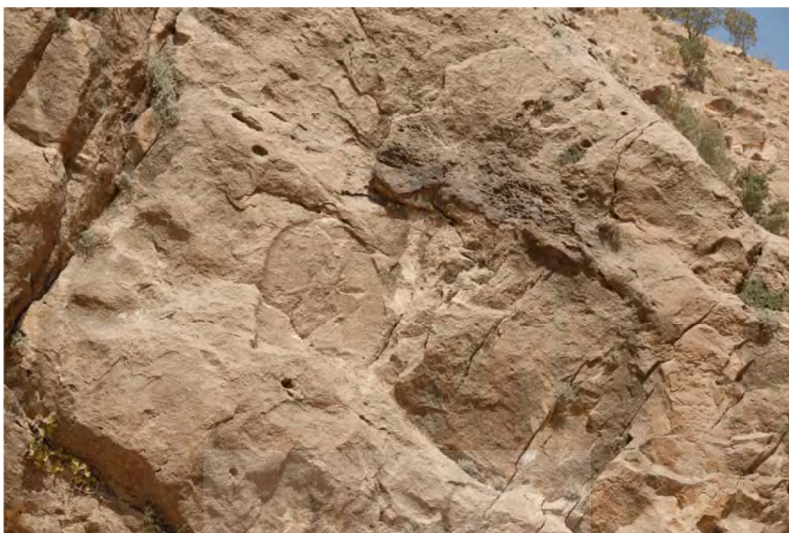
تصویر ۵: نقش برجسته آشوری میشخاص