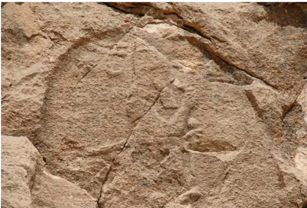
تصویر ۷: جزئیات نقش برجسته آشوری میشخاص