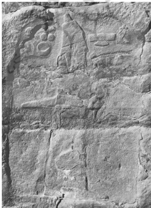
تصویر ۲: تصویری از نقش برجسته اشکفت گل گل (برگرفته از: Vanden Berghe, 1973: PL. XIII).