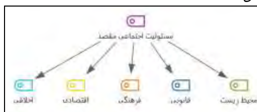
شکل ۳. مدل ابعاد مسئولیت اجتماعی مقصد برگرفته از نتایج پژوهش کیفی تحقیق در نرم افزار MAXQDA