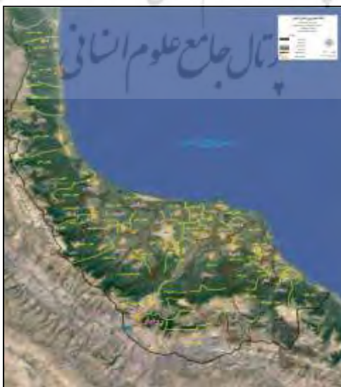
شکل ۲. نقشه استان گیلان و محدوده پژوهش

استان گیلان از استان‌های شمالی کشور به مرکزیت کلانشهر رشت است. این استان، از شمال به دریای خزر و کشور آذربایجان (که از طریق شهرستان آستارا با آن دارای مرز بین‌المللی است)، از غرب به استان اردبیل، از جنوب به استان زنجان و قزوین و از شرق به استان مازندران محدود می‌شود. مساحت استان گیلان ۱۴۰۴۴ کیلومتر مربع است. بر اساس آخرین تقسیمات سیاسی؛ استان گیلان مشتمل بر ۱۶ شهرستان، ۴۳ بخش، ۵۲ شهر و ۱۰۹ دهستان می‌باشد (سامانه اطلاعات آماری استان گیلان، ۱۳۹۸). محدوده مورد مطالعه پژوهش شامل تمامی مقاصد گردشگری سیاحتی، زیارتی، سرگرمی، پارک‌ها و فضاهای سبز، هتل‌ها، اقامت‌گاه‌ها، رستوران‌ها در کلیه شهرها و روستاهای استان گیلان می‌باشد که در شکل (۲) نشان داده شده است.