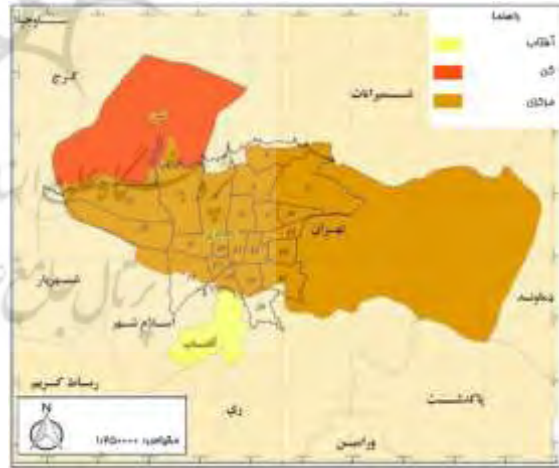
شکل ۵. موقعیت سیاسی اداری شهرستان تهران