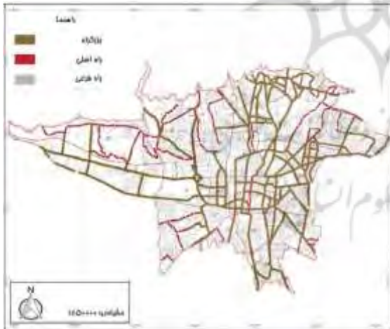
شکل ۶. ساختار شبکه معابر شهر تهران

مقیاس مکانی مطالعه حاضر، منطقه کلانشهری تهران است که شامل شهر تهران و حوزه نفوذ پیرامونی آن می‌باشد. این مجموعه شهری بزرگ به عنوان پایتخت و بزرگترین شهر ایران و بزرگترین منطقه شهری کشور می‌باشد که مساحت آن در حدود ۱۸۸۱۴/۱۲ کیلومتر مربع بوده و از نظر وسعت به تنهایی ۱/۱۴ درصد از کشور را تشکیل می‌دهد. براساس سرشماری رسمی نفوس و مسکن ۱۳۹۵ در حدود ۲۰ درصد از جمعیت کشور معادل ۱۵۹۸۰۰۳۷ نفر در مجموعه شهری تهران زندگی می‌کنند. این مجموعه در مرکز شبکه ارتباطی کشور قرار گرفته و بیش از ۴۰ درصد فعالیت‌های اقتصادی ایران در آن انجام می‌شود (کازمی‌پور و حاجیان، ۱۳۹۸). در سند چشم‌انداز تهران ۱۴۰۴، تهران شهری است با حمل‌ونقل روان و با سامانه جامع حمل‌ونقل با محوریت حمل‌ونقل عمومی قابل اعتماد، در دسترس، ایمن، سریع و ارزان. این سامانه با برقراری ارتباطات اثربخش در سطح مجموعه شهری، ملی و فراملی، چشم‌انداز تهران را به خوبی پشتیبانی می‌کند (شهرداری تهران، ۱۳۸۶).