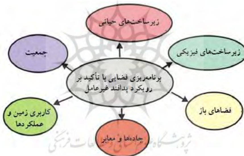
شکل ۱. مؤلفه‌های اساسی برنامه‌ریزی فضایی با تأکید بر پدافند غیرعامل