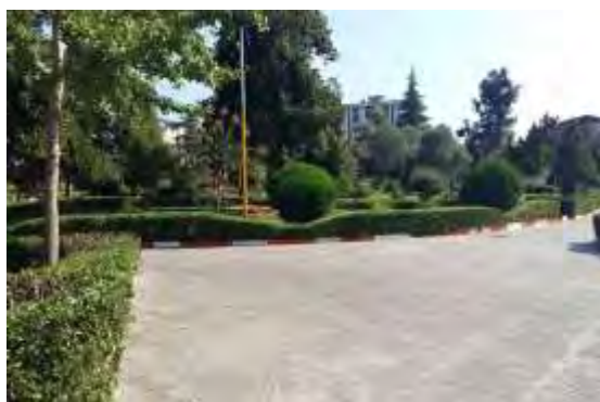
شکل ۲. فضای سبز پارک مادر