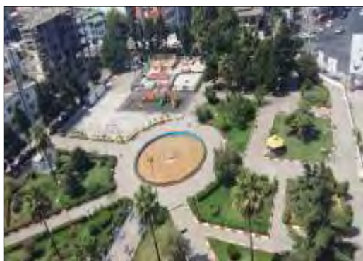
شکل ۳. فضای سبز پارک جوان