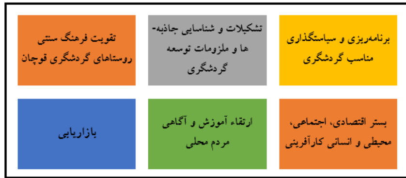
شکل ۲. راهکارهای موثر در توسعه گردشگری، منبع: یافته‌های تحقیق، ۱۴۰۲

مطابق نتایج جدول (۲) و شکل (۲)، راهکارهایی از جمله: برنامه‌ریزی و سیاستگذاری مناسب گردشگری، تشکیلات و شناسایی جاذبه‌ها و ملزومات توسعه گردشگری، تقویت فرهنگ سنتی روستاهای گردشگری قوچان، بستر اقتصادی، اجتماعی، محیطی و انسانی کارآفرینی گردشگری، ارتقاء آموزش و آگاهی مردم محلی، بازاریابی در امر گردشگری از سوی متخصصان پیشنهاد شد.