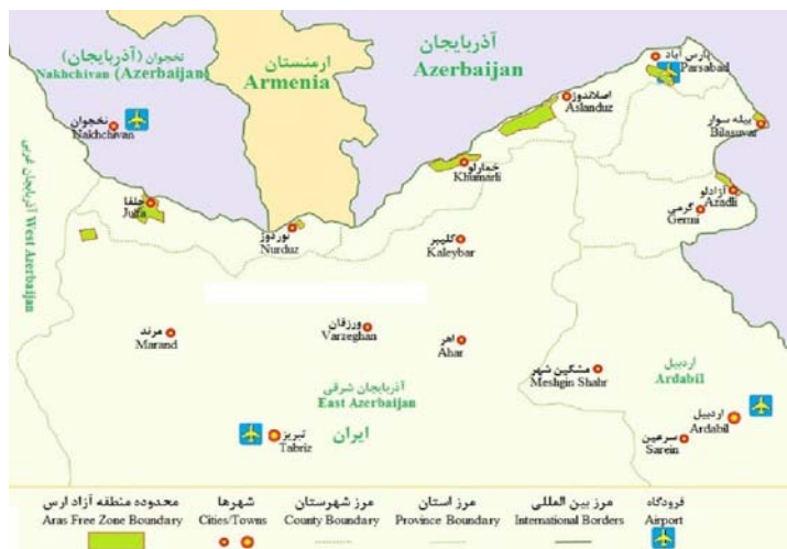
شکل شماره ۲: نقشه شهرهای پیرامون منطقه آزاد ارس