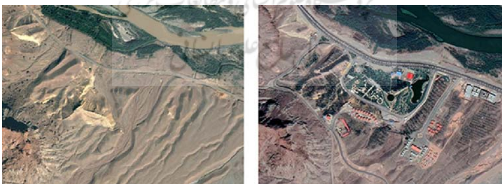
شکل شماره ۴: تصاویر ماهواره‌ای گوگل ارث؛ تغییر کاربری زمین بایر به وسعت بیش از ۳۰ هکتار به مرکز تجاری، تفریحی و رفاهی با نام پارک کوهستانی منطقه آزاد ارس طی سال‌های ۱۳۸۶ (تصویر سمت چپ) تا ۱۴۰۰ (تصویر سمت راست)