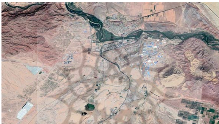
شکل شماره ۳: تصویر ماهواره‌ای گوگل ارث؛ توسعه شهری، توسعه صنعتی - اقتصادی شهر جلفا در مهرماه ۱۴۰۰