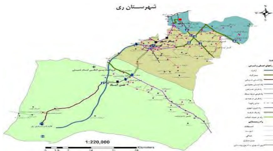
شکل ۲. نقشه محدوده مورد مطالعه