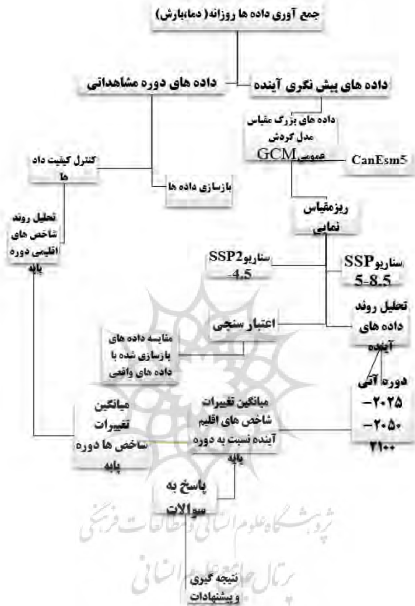
شکل ۱ - نمودار مراحل انجام روش تحقیق