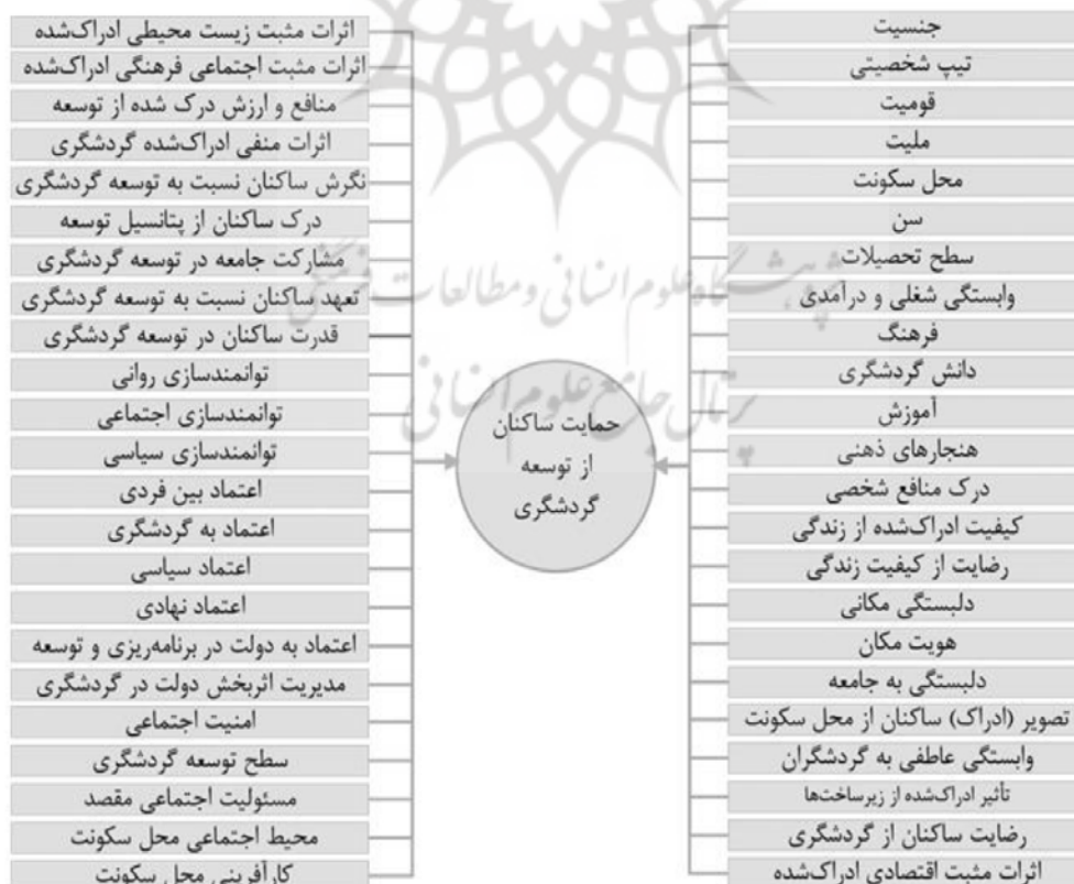
شکل ۱: الگوی مفهومی اولیه پژوهش. عوامل مؤثر در حمایت ساکنان از توسعه گردشگری بر اساس پیشینه پژوهش

را افزایش می‌دهد. در مقابل، درآمد کم، تحصیلات پایین و منافع شخصی کمتر از گردشگری به توسعه خوشه‌های مکانی با ادراک منفی از تأثیرات گردشگری منجر می‌شود؛ به طوری که در نهایت موجب کاهش حمایت از توسعه گردشگری می‌شود. شکوهی و یزدان‌پناه (2019) در پژوهشی تأثیر ابعاد توانمندسازی را در نگرش به تأثیرات گردشگری و حمایت از توسعه گردشگری بررسی کردند. نتایج پژوهش ایشان نشان داد که ابعاد اجتماعی، روانی و محیطی توانمندسازی، همچنین سود اقتصادی شخصی، نگرش به تأثیرات مثبت گردشگری را تحت تأثیر قرار می‌دهد و سود اقتصادی شخصی و توانمندسازی بر نگرش افراد به تأثیرات منفی گردشگری مؤثر است. همچنین نتایج پژوهش ایشان نشان داد که تأثیرات مثبت گردشگری و توانمندسازی‌های روانی، اجتماعی و سیاسی تأثیر بسزایی در حمایت ساکنان از توسعه گردشگری دارند. گرسوی ۱ و همکاران (2019) در پژوهشی تأثیر مسئولیت اجتماعی ادراک شده هتل‌ها را (در ابعاد اقتصادی، اجتماعی و محیطی) در احساسات ساکنان به جامعه