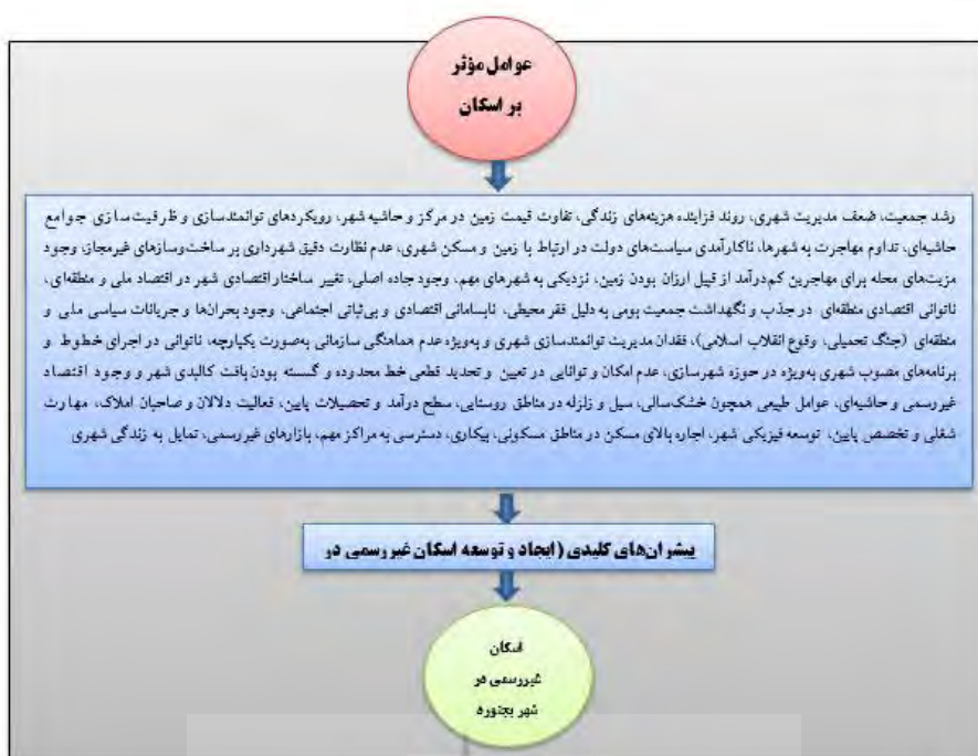
شکل ۱. مدل مفهومی عوامل اولیه تأثیرگذار بر اسکان غیررسمی بجنورد (شکل‌گیری و گسترش)