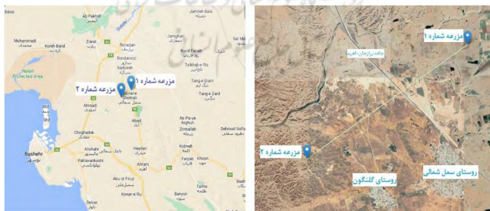
شکل ۱: موقعیت مکانی مزارع چغندر قند

این پژوهش، در دو سطح مزرعه (مزرعه شماره ۱ و ۲) با سه سطح رقم (شریف، SBSI 061 و پالما)، و تاریخ‌های کاشت تاخیری در دو سطح (۲۰ و ۲۸ آبان) با سه تکرار اجرا شد. مزرعه شماره ۱ در اراضی روستای سمل شمالی از توابع شهرستان تنگستان و مزرعه شماره ۲ در اراضی روستای گلنگون از توابع شهرستان تنگستان در استان بوشهر قرار دارد (شکل ۱). میانگین بارش ۲۶۰ میلی‌متر و دما ۲۴ درجه سانتی‌گراد است. آب و هوا بر اساس روش آمبرژه، گرم و خشک تعیین شده است (مرکز هوا و اقلیم‌شناسی بوشهر، ۱۳۹۶). نتایج آزمون خاک و آب (جداول ۱ و ۲) نشان از تفاوت دو منطقه دارد.