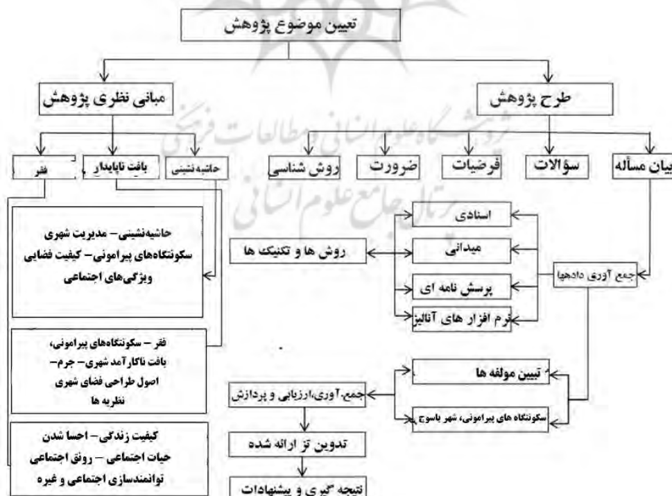
شکل ۳. مدل پژوهش

پژوهش حاضر برحسب ماهیت، توصیفی - استنباطی و بر حسب هدف تحقیق دانش‌پژوهی (توسعه‌ای - کاربردی) و این پژوهش ماهیت تحلیلی - توصیفی نیز دارد و برای تکمیل پرسشنامه از روش نمونه‌گیری تصادفی استفاده شده است. چارچوب مکانی پژوهش، محدوده‌ی قانونی شهر یاسوج، سکونتگاه‌های مادوان سفلی، بله‌زار و مهریان می‌باشد و جامعه‌ی آماری مشتمل بر جمعیت شهر یاسوج و سکونتگاه‌های پیرامونی شامل مادوان سفلی، بله‌زار و مهریان (تعداد ۱۵۴۴۴۰ نفر) می‌باشد.