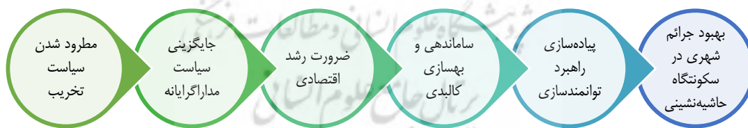
شکل ۱. نمودار ارتباط ساماندهی و توانمندسازی در جرائم شهری

رفتار و شخصیت هر فرد انعکاسی مستقیم و غیرمستقیم واقعیت‌های عینی محیط اجتماعی او در طول زندگی‌اش می‌باشد، اگر در جامعه‌ای ناهنجاری‌ها دیده می‌شود، باید ریشه اش را در درون آن جامعه جستجو کرد. (Sedigh, 2012).