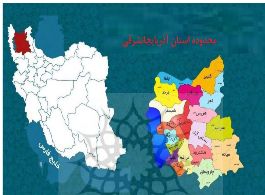
شکل ۴ - محدوده استان آذربایجان شرقی

در بین شهرستان‌های استان، شهرستان میانه با ۵۵۹۵.۳۰ کیلومترمربع وسیع‌ترین و شهرستان عجب‌شیر با ۷۳۸۰۴۴ کیلومترمربع کمترین مساحت استان را به خود اختصاص داده است. در سال ۱۳۹۵ در بین ایستگاه‌های استان، بالاترین بیشینه و پایین‌ترین کمینه درجه حرارت ثبت شده، مربوط به شهر جلفا و میانه با ۴۳ درجه سانتی‌گراد و شهر ورزقان با ۲۸- درجه سانتی‌گراد بوده است.