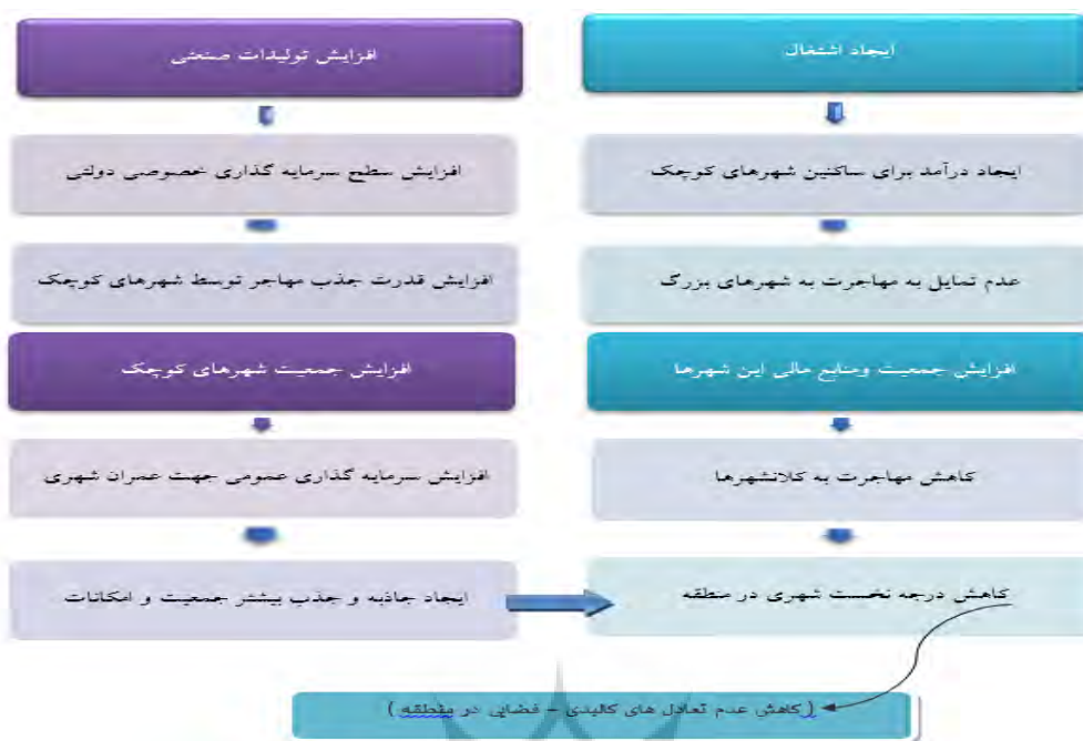
شکل ۳ - مدل مفهومی برای تبیین نقش شهرهای کوچک (فرایند تقویت شهرهای کوچک و پیامدهای انتظار آن در منطقه).