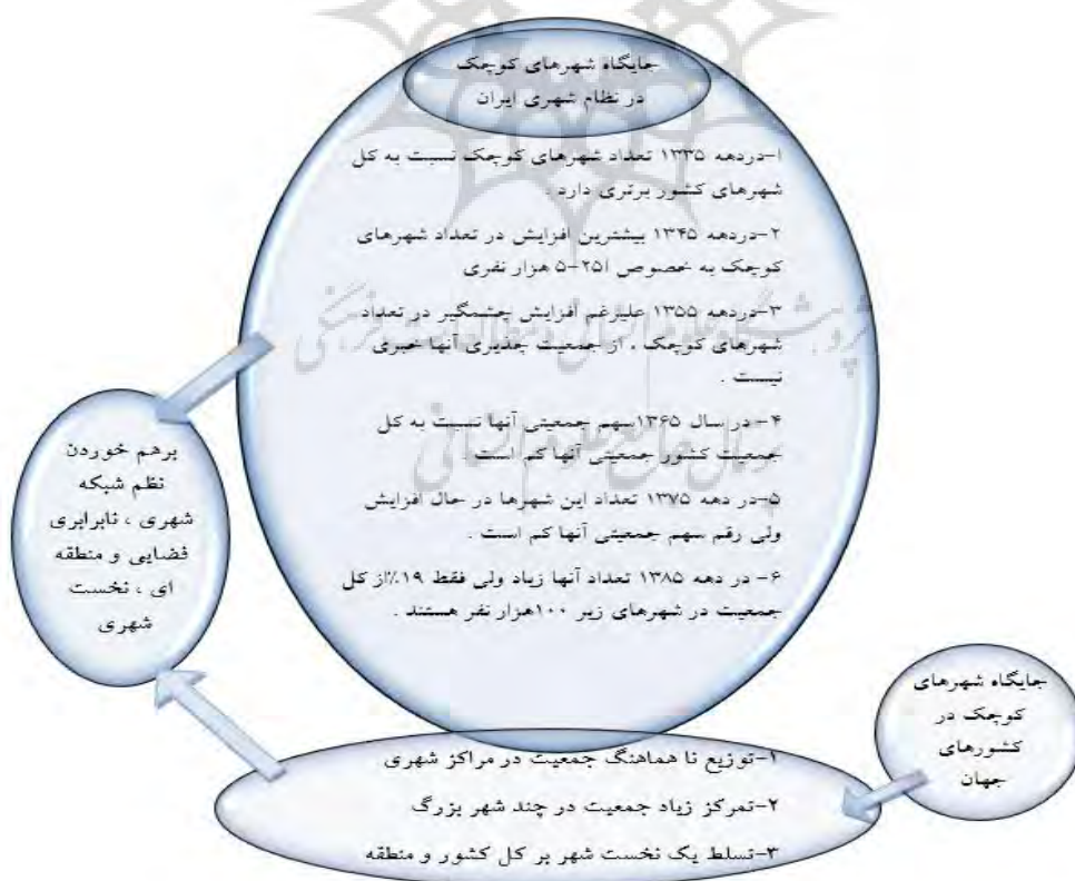
شکل ۲ - شکل جایگاه شهرهای کوچک