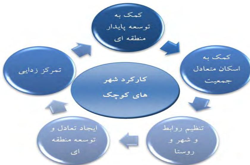
شکل ۱ - کارکردهای شهرهای کوچک