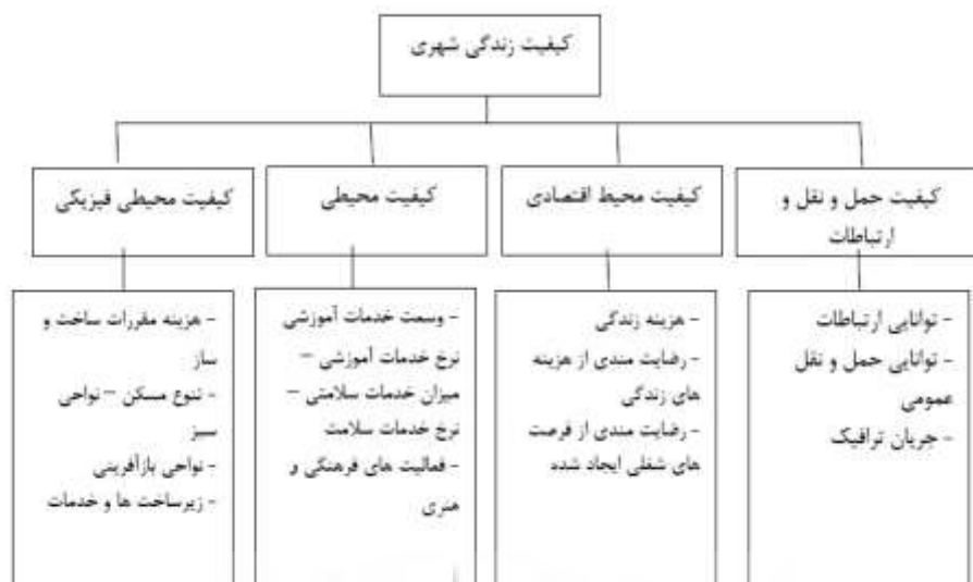
نمودار ۱ - ابعاد مختلف کیفیت زندگی شهری و متغیرهای مورد استفاده (ماخذ قالبیاف و همکاران، ۱۳۹۰)