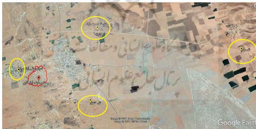
شکل ۲: مراکز جاذب گردشگر در مجاورت محدوده روستای سیف‌آباد بالایی (قدیم)

در پیرامون روستای تاریخی سیف‌آباد بالایی (قدیم) سایت‌های باستان‌شناسی و مراکز جاذب گردشگری بسیاری از جمله: ۱- دریاچه پریشان، ۲- تُل قلعه سیف‌آباد (متعلق به دوران ساسانیان)، ۳- تُل خندق (متعلق به قرن ۴ و ۵ ه.ق، دوران اولیه اسلامی)، ۴- تُل تاریخی بَجی (آثاری از سکونت متعلق به دوران هزاره اول و دوم قبل از میلاد) و ۵- آسیاب علی‌آباد دوتو (متعلق به دوران قاجار) وجود دارد.