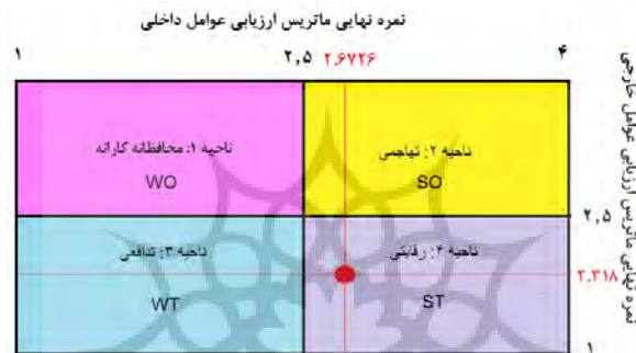
شکل ۳: الگوی ارزیابی و انتخاب راهبرد تحقق توسعه‌ی گردشگری در روستای سیف‌آباد قدیم

سیف‌آباد قدیم، نمره نهایی ماتریس ارزیابی عوامل داخلی ۲/۶۷۲۶ و نمره نهایی ماتریس ارزیابی عوامل خارجی ۲/۳۱۸ است. ۱. سنتتاج نهایی از ماتریس ارزیابی عوامل داخلی (مجموع نمره نهایی ۲/۶۷۲۶) بیانگر این است که قوت‌های فرآوری توسعه‌ی گردشگری در روستای سیف‌آباد قدیم، بیشتر از ضعف‌های پیرامون آن بوده و راهبردهای کلان‌بایده‌گونه‌ای تدوین شود که بتوان بر ضعف‌های موجود غلبه نمود. نتایج حاصل از اطلاعات به دست آمده از ماتریس ارزیابی عوامل داخلی و ماتریس ارزیابی عوامل خارجی و همچنین وضعیت کلی تحقق توسعه‌ی گردشگری در روستای سیف‌آباد قدیم و ماتریس چهارخانه‌ای ارزیابی عوامل داخلی و خارجی (IE) در شکل شماره (۳) ارائه شده است.