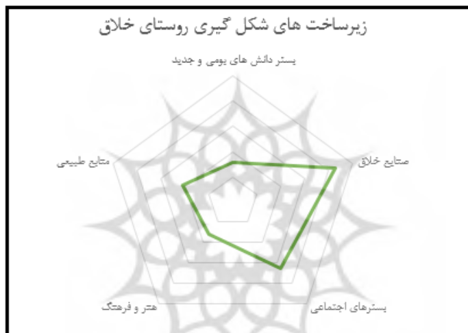
شکل ۳. نمودار زیرساخت های شکل گیری روستای خلاق