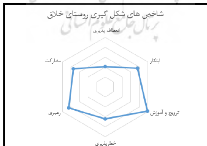
شکل ۴. نمودار شاخص های شکل گیری روستای خلاق