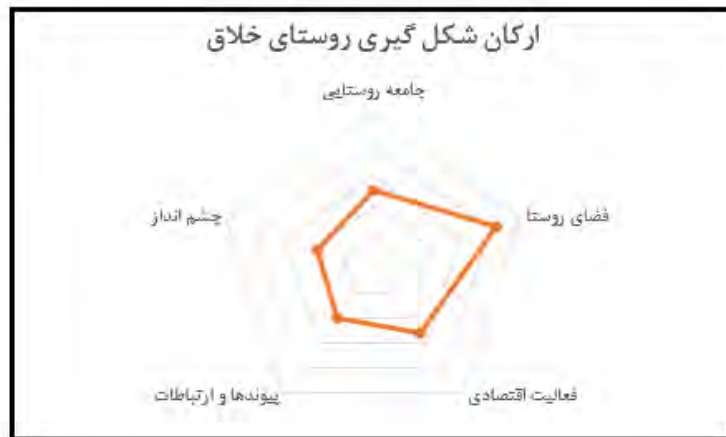
شکل ۲. نمودار ارکان شکل گیری روستای خلاق