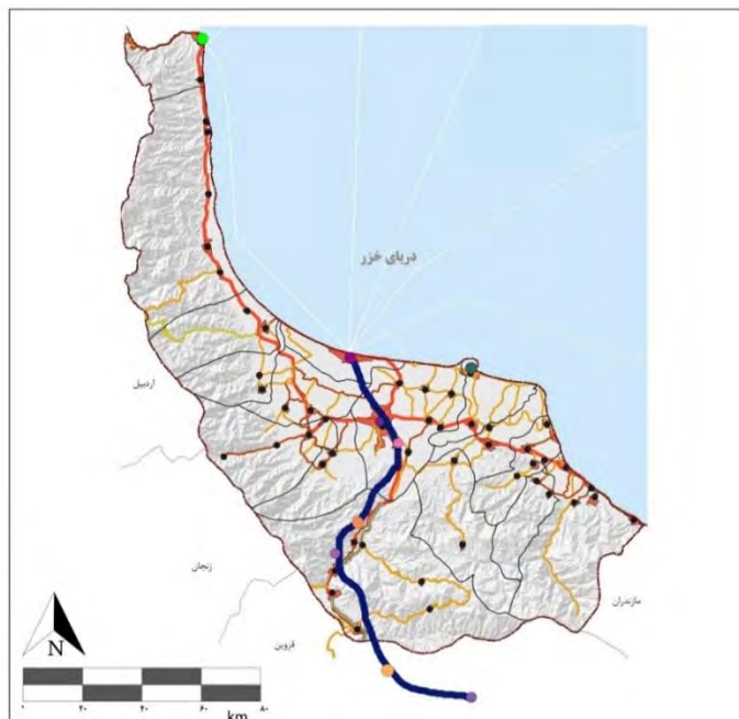
عنوان نقشه: نقشه زیرساخت‌های حمل و نقلی استان گیلان