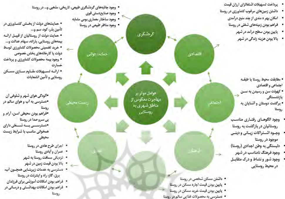
شکل ۱. عوامل مؤثر بر مهاجرت معکوس از مناطق روستایی به مناطق شهری