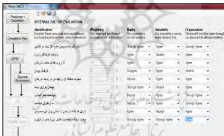
شکل ۵. ارزیابی منابع و قابلیت‌ها براساس دیدگاه مبتنی بر منابع

برای انجام این کار، منابع براساس یک طیف پنج‌تایی از (خیلی موافقم، موافقم، خنثی، مخالفم، خیلی مخالفم) براساس نظر کارشناسان سنجش می‌شود. معیار باارزش‌بودن (V) در این مرحله سنجش نمی‌شود؛ زیرا فقط زمانی می‌توان این مورد را سنجید که در مقایسه با عوامل خارجی باشد. پاسخ‌های کارشناسان از نظر میزان موافقت با عباراتی همچون این‌ها همراه خواهد بود: کمیاب (R): رقبای ما قادر به انجام این کار نیستند؟ تقلیدپذیری (I): رقبای ما قادر به تقلید این قابلیت نیستند؟ جایگزین‌نشدن (O): ما از این عامل به واسطه خط‌مشی جبران خود بهره می‌بریم؟ (بدری و همکاران، ۱۳۹۴، ص. ۷).