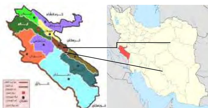
شکل ۱. موقعیت و تقسیمات سیاسی استان ایلام در کشور، ۱۳۹۵