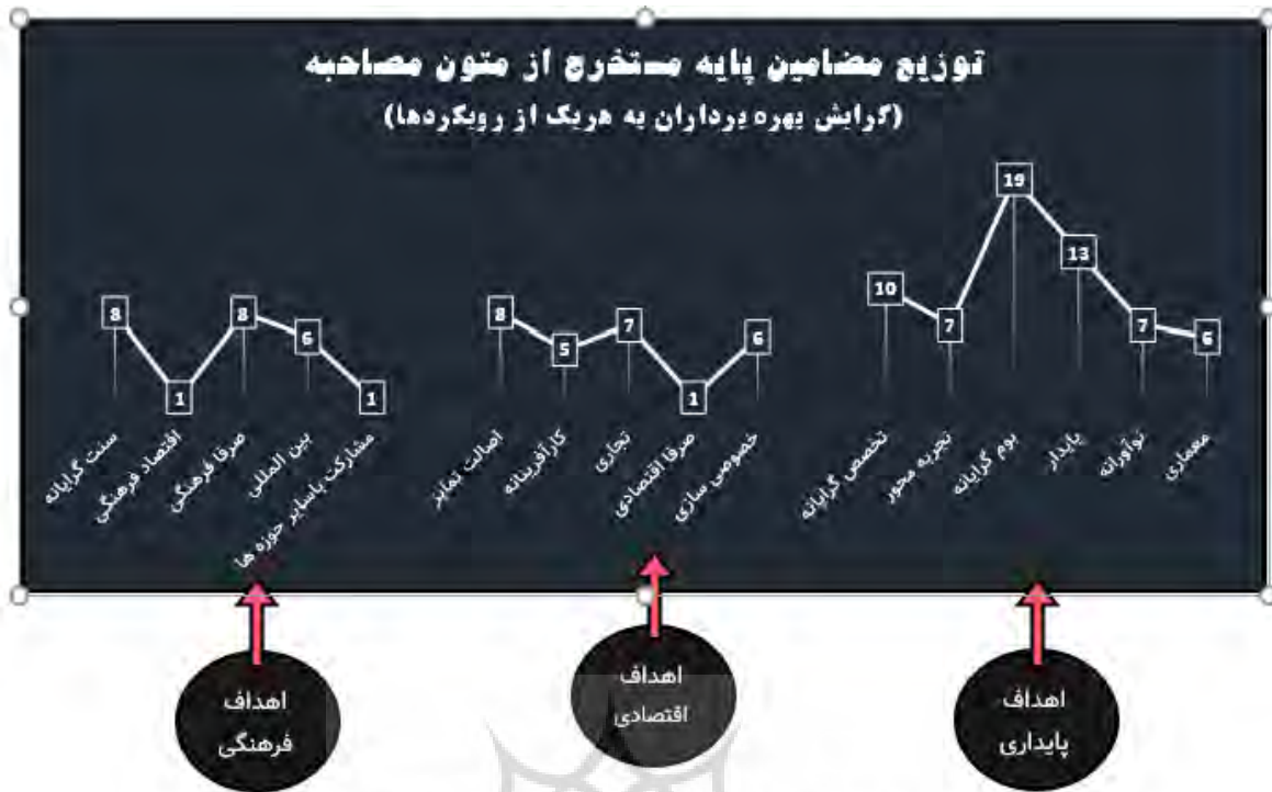
شکل ۳- نمودار توزیع مضامین پایه برگرفته از اظهارات مصاحبه شوندگان در رویکردهای قابل اتخاذ در هر یک از اهداف.