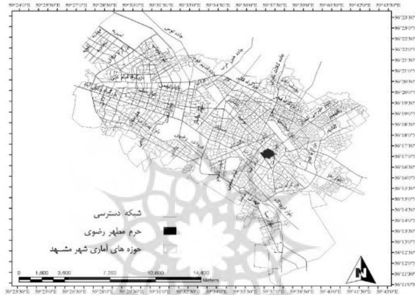
شکل شماره چهار- حوزه های آماری شهر مشهد