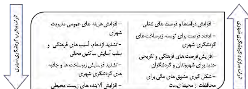
شکل شماره یک- اثرات سازنده اقتصادی، اجتماعی و زیست محیطی گردشگری شهری برگرفته از هیل ۱ (۲۰۱۱).

پروژه‌های توسعه شهری می‌تواند بستر مناسبی را برای ایجاد موازنه میان منافع کنشگران عمومی، خصوصی و مردمی فراهم سازد. مدل 4P فرصت‌های جدیدی را برای توزیع متوازن منافع از طریق کاربست روش‌های جدید، فعال و سازنده مشارکت در تمامی مراحل فرآیند توسعه شهری از مراحل برنامه‌ریزی و طراحی تا مراحل اجرایی و عملیاتی فراهم می‌سازد (بونویوتی، ۲۰۲۱). از طرف دیگر در این مدل بر مشارکت فعال شهروندان در مراحل برنامه‌ریزی، طراحی و ارزیابی طرح‌های توسعه شهری تأکید شده است (بونویوتی، ۲۰۲۱؛ مارانا و همکاران، ۲۰۲۰). از مهم‌ترین مزایای مدل 4P، تعدیل احتمال مخالفت گروه‌های مختلف اجتماعی با پیشرفت پروژه‌های شهری، ایجاد مسؤلیت برای شهروندان در مراحل مختلف اجرای پروژه‌های توسعه شهری، تعدیل تضییع حقوق شهروندان و استفاده‌کنندگان نهایی از فضا و ایجاد فرصت برای نهادهای عمومی غیر انتفاعی برای مشارکت در روند توسعه شهری است (بونویوتی، ۲۰۲۱؛ مارانا و همکاران، ۲۰۲۰؛ مارانا و همکاران، ۲۰۱۸؛ ان جی و همکاران، ۲۰۱۳). هدف اصلی طرف‌های شراکت‌کننده در مدل 4P، سودآوری و بازگشت سرمایه نمی‌باشد و حتی ممکن است پروژه‌ها توسط عموم مردم با رویکردی خیرخواهانه به انجام برسد. علاوه بر این در این مدل امکان نقش‌آفرینی فعالان اجتماعی و اقتصادی دارای نفوذ در ارگان‌های دولتی نیز در کنار سایر کنشگران فراهم می‌شود (باتیدزیرای ۲ و همکاران، ۲۰۲۱؛ بونویوتی، ۲۰۲۱؛ مارانا و همکاران، ۲۰۲۰). با کاربست مدل 4P سطح بالایی از یکپارچگی میان کنشگران و نهادهای