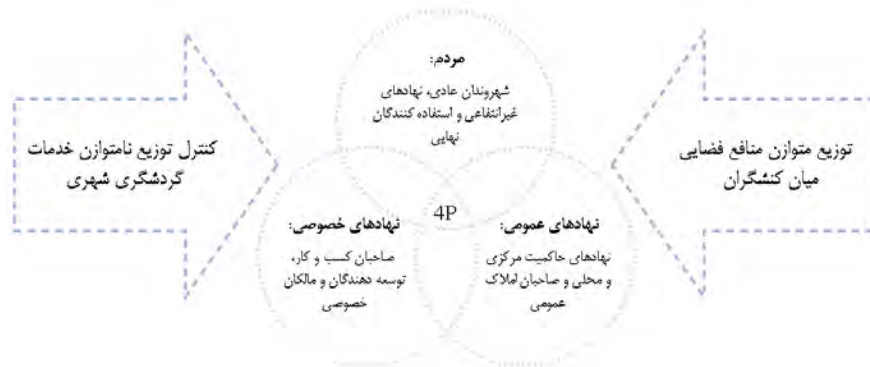
شکل شماره دو- مدل مفهومی پژوهش

رسمی و غیررسمی تأثیرگذار در پیشرفت طرح‌های توسعه شهری در قالب یک نظام منسجم و با هدف