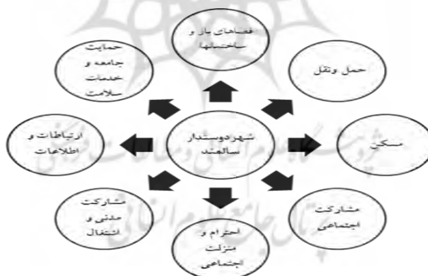
شکل ۱. مؤلفه‌های کلیدی شهر دوستدار سالمند (Buffel et al, 2018: 17)

موضوع اصلی در این زمینه این است که افراد سالمند تنها به‌عنوان بهره‌برداران جوامع شهر دوستدار سالمند شناخته نمی‌شوند، بلکه می‌توانند نقش عمده و حیاتی در ایجاد این چنین جوامعی داشته باشند (Buffel & Philipson, 2016: 95). ارتقای کیفیت زندگی شهری سالمندان نیازمند ارزیابی کیفیت خدمات و زیرساخت‌های شهری و میزان مطابقت شهر با موضوع شهر دوستدار سالمند است؛ زیرا بر اساس این ارزیابی‌ها می‌توان برنامه‌ریزی شهرهای دوستدار سالمند را عملی کرد. ارزیابی وضعیت شهر دوستدار سالمند نیازمند استفاده از ابزارها و روش‌های کارآمدی است که بتواند شاخص‌های متعدد و اثرگذار در کیفیت زندگی سالمندان را در نظر بگیرد، آن‌ها را تلفیق سازد و در نهایت محیط زندگی شهری سالمندان را ارزیابی کند. در این میان عواملی که بر شهر دوستدار سالمند مؤثرند، توسط سازمان بهداشت جهانی معرفی شده‌اند. (شکل شماره ۱). پروتکل شهر دوستدار سالمند که در شمال آمریکا یک ارزیابی کیفی از محیط‌های انسان‌ساخت، اجتماعی، و خدماتی ارائه داده شامل: فضاهای باز و ساختمان‌ها، حمل‌ونقل، مسکن، مشارکت اجتماعی، تکریم سالمندان و شمولیت اجتماعی، مشارکت شهروندی و استخدام، ارتباطات و اطلاعات، و خدمات سلامتی و محلی است.