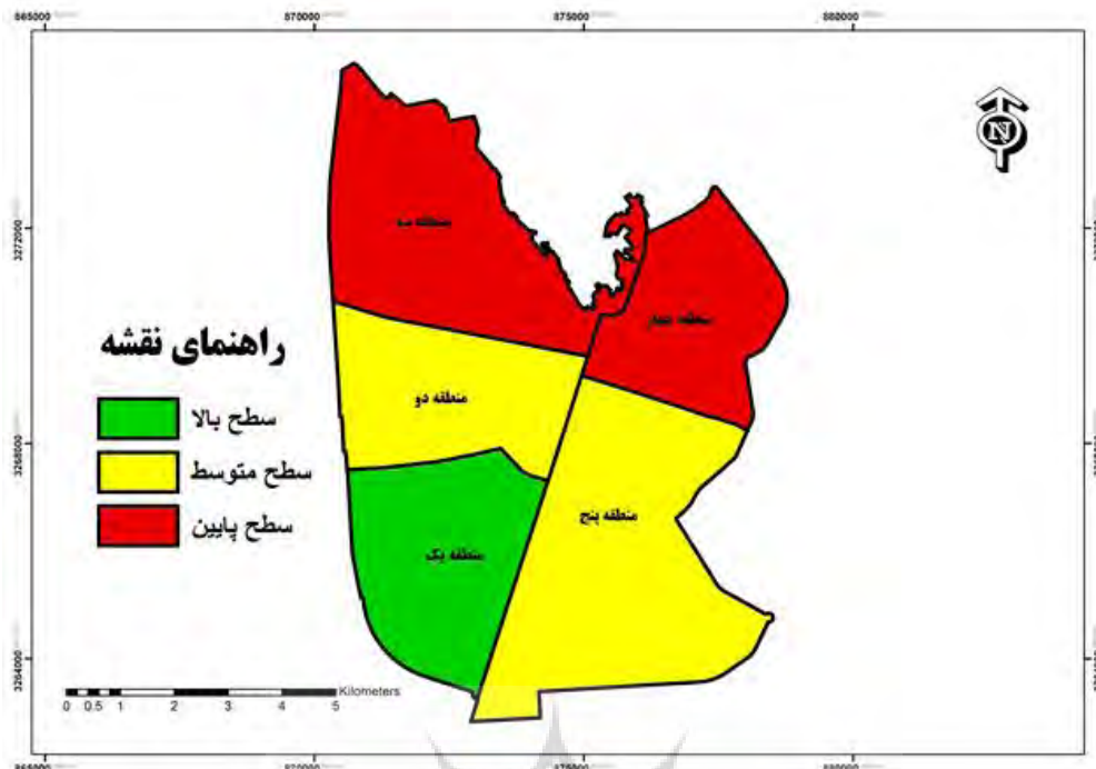
شکل ۲. سطح رقابت‌پذیری اقتصادی مناطق پنجگانه شهر زاهدان

آن‌ها و همچنین سکونت طبقات اجتماعی بالا در سطح منطقه یک، زیرساخت‌های جدید، امکان تحقق‌پذیری سرانه‌های آموزشی، فرهنگی در این زمینه نیز می‌تواند تأثیرگذار باشد.