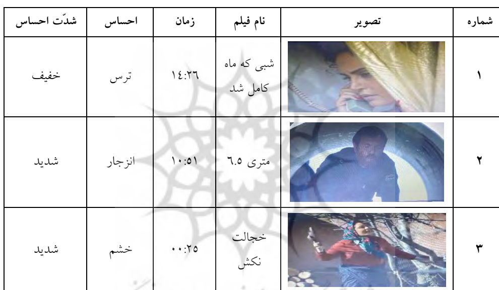
جدول ۲. احساسات توصیف‌نشده

با توجه به اینکه احساسات مصور در جدول شماره ۲ ترجمه و توصیف نشده‌اند، بنابراین توضیحی در نسخه کم/نابینایان برای این صحنه‌ها بیان نشده است و از همین رو پژوهشگر ستون مربوط به ترجمه و توصیف را از این جدول حذف کرده است. در نمونه دوم تصویری از اشکانی را می‌بینیم که پس از رویارویی با جنازه فردی معتاد حالش بد و منزجر می‌شود. احساس انزجار ترجمه و توصیف نشده است. شایان یادآوری است که در همه فیلم‌ها احساسات توصیف‌نشده فراوان بود.