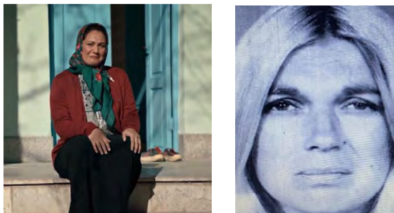
تصویر ۱. نمود شدت احساس غم

نه تنها پلک‌ها غمگین است، بلکه چشم‌ها هم در بخش بالایی صورت صنم حالت افتادگی رو به پایین دارد. در غم و اندوه اغلب حالت چشم‌ها به سمت پایین است. اگر غم و اندوه با شرم یا احساس گناه همراه باشد، تاج ابروها به سمت بالا می‌رود و حالت بینی و دهان رو به پایین می‌افتد. در این پژوهش، نمود احساس و شدت آن برای همه شخصیت‌ها در پیکره پژوهشی بررسی شد.