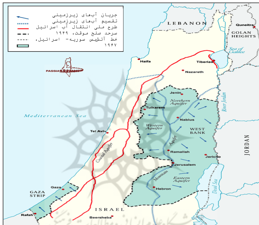
نقشه ش (۲): منابع آب (http://www.passia.org/palestine_facts/MAPS/WaterSources.html)

آب را به‌عنوان یک حق انسانی می‌شناسد و در برابر کسانی که در مناطق اشغالی ساکنند از توزیع عادلانه و مداوم آب حمایت می‌کند (Abu-Eid, 2007: 300). با این حال، با توجه به احتمالاتی که وجود دارد، تاکنون اجرای این قانون به دلیل فقدان قدرت نظامی، سیاسی و اقتصادی تشکیلات فلسطینی ممکن نبوده است.