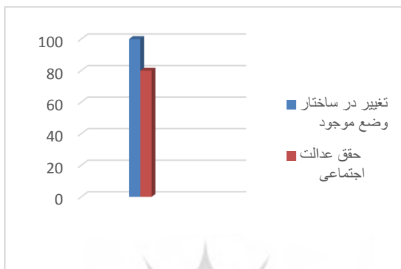
بسامدسنجی سطوح فکری غالب بر اشعار حافظ

بسیاری داشته و در سطوح فکری اشعار سنایی به دلیل اشتغال بر دلالت‌های معرفتی، وضعیتی و به‌ویژه دلالت هنجاری، از ابعاد و قابلیت‌های مهم مدنی و سیاسی برخوردار است. نمودار این بسامد در ذیل ترسیم می‌گردد.