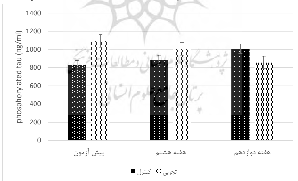
شکل ۲. مقایسه تغییرات سطح پروتئین فسفوریله تائو پلاسمای زنان سالمند در مراحل مختلف تحقیق.

نتایج حاصل از آزمون t مستقل نشان داد که بین سطح پروتئین فسفوریله تائو در مراحل مختلف تحقیق در بین گروه ها تفاوت معنی داری وجود ندارد ( p > 0.05 )؛ همچنین نتایج بر آمده از آزمون تحلیل واریانس با اندازه گیری مکرر نشان داد که بین سطوح پلاسمایی پروتئین فسفوریله تائو در مراحل مختلف تحقیق و در گروه های شرکت کننده، تفاوت معنی دار آماری ( F=1/927, P=0/182 ) وجود ندارد (شکل ۲).