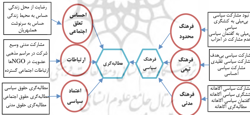
شکل شماره (۱). الگوی نظری میزان تأثیر فرهنگ سیاسی بر مطالبه‌گری مدنی