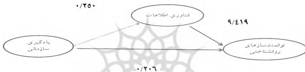
شکل (۲) رابطه علی متغیرها در حالت معناداری