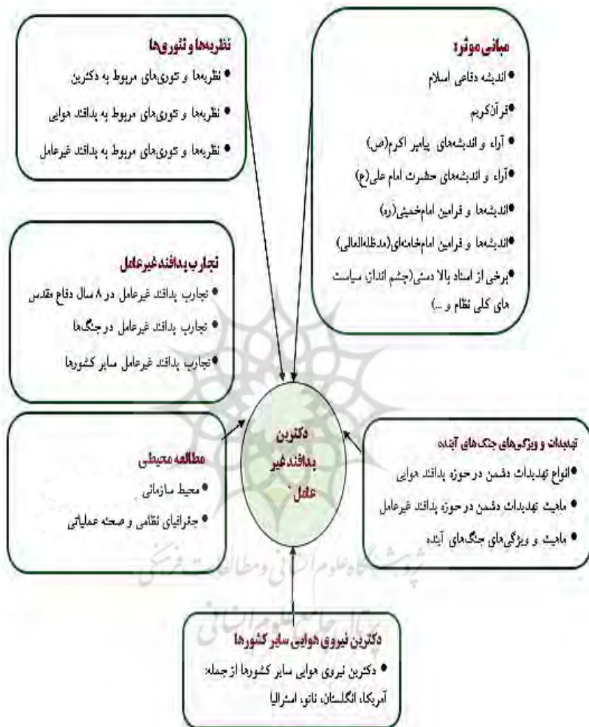
شکل (۲) چارچوب نظری دکترین پدافند غیرعامل با رویکرد پدافند هوایی

در ادامه براساس آنچه که از مرور ادبیات و اسناد و مدارک مرتبط احصاء شد، چارچوب نظری پژوهش ارائه می‌شود: