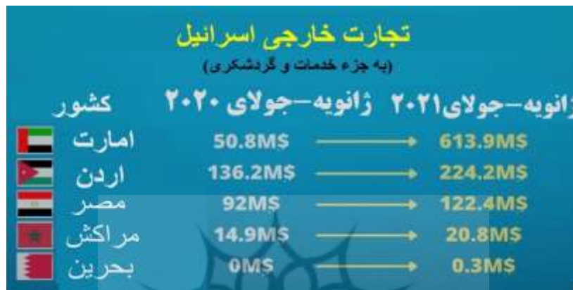
شکل ۳. تجارت خارجی اسرائیل با برخی کشورهای عربی (۲۰۲۰-۲۰۲۱)