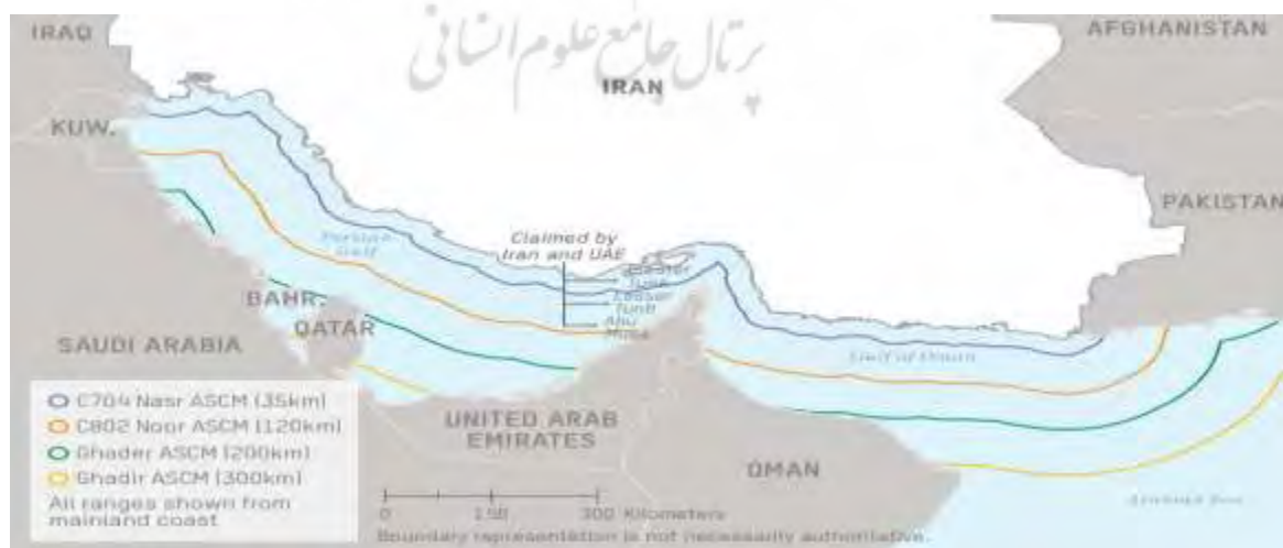
نقشه ۲- برد موشک‌های دریایی ج.ا. ایران (DIA, ۲۰۱۹, p. ۵۵)

توانایی‌های دریایی ایران استراتژی قطع دسترسی منطقه‌ای از سوی ایران را مورد تأکید دارد. ایران با بهره‌مندی از موقعیت ژئواستراتژیک خود در امتداد خلیج فارس و تنگه هرمز، قابلیت‌های دریایی مبتنی بر تاکتیک‌های نامتقارن با استفاده از پلتفرم‌ها و سلاح‌های بی‌شماری که می‌تواند برای غلبه بر نیروی دریایی دشمن مؤثر باشد را توسعه داده است. طیف گسترده‌ای از این قابلیت‌ها برای ایران در دسترس است که شامل: موشک‌های کروز سوار بر کشتی و مستقر در ساحل، قایق‌های کوچک تندرو، مین‌های دریایی، زیردریایی‌ها، هواپیمای بدون سرنشین، موشک‌های بالستیک ضدکشتی و دفاع هوایی است.