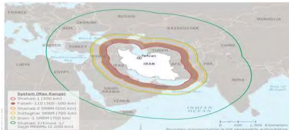
نقشه ۱- برد توان موشکی ج.ا. ایران (DIA, ۲۰۱۹, p. ۳۳)

توانایی‌های دریایی ایران استراتژی قطع دسترسی منطقه‌ای از سوی ایران را مورد تأکید دارد. ایران با بهره‌مندی از موقعیت ژئواستراتژیک خود در امتداد خلیج فارس و تنگه هرمز، قابلیت‌های دریایی مبتنی بر تاکتیک‌های نامتقارن با استفاده از پلتفرم‌ها و سلاح‌های بی‌شماری که می‌تواند برای غلبه بر نیروی دریایی دشمن مؤثر باشد را توسعه داده است. طیف گسترده‌ای از این قابلیت‌ها برای ایران در دسترس است که شامل: موشک‌های کروز سوار بر کشتی و مستقر در ساحل، قایق‌های کوچک تندرو، مین‌های دریایی، زیردریایی‌ها، هواپیمای بدون سرنشین، موشک‌های بالستیک ضدکشتی و دفاع هوایی است.