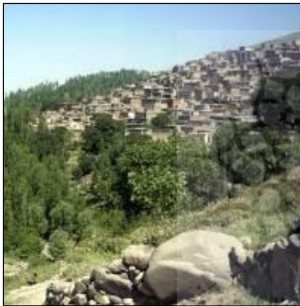
شکل 17: اقلیم معتدل و کوهستانی روستا