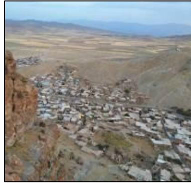
شکل 8: قرارگیری روستا در پهنه کوه