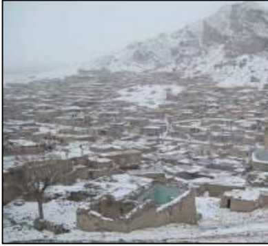
شکل 9: اقلیم کوهستانی و سرد روستا