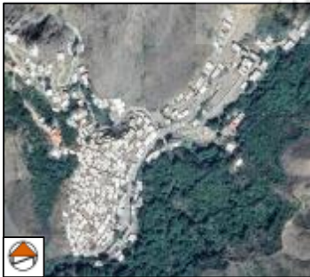
شکل 11: عکس هوایی اشتبیین

این روستا در شمال غربی استان واقع شده و از توابع بخش شهرستان جلفا می‌باشد. بنابر اطلاعات خانه بهداشت، این روستا بالغ بر 1034 نفر جمعیت، 295 خانوار و در حدود 341 واحد مسکونی دارد. این تعداد جمعیت شامل 532 نفر مرد و 502 نفر زن می‌باشد. روستای اشتبیین دارای خانه‌هایی با معماری پلکانی است، به طوری که حیاط یک خانه سقف خانه‌ای دیگر می‌باشد. انواع معیشت موجود در روستا عبارت است از کشاورزی، دامداری، دامپروری و صنایع دستی. روستای اشتبیین در 17 خرداد 1379 هجری خورشیدی با شماره ثبت 2692 به عنوان یکی از آثار ملی ایران به ثبت رسیده است و همچنین مقبره ابوالقاسم نباتی، شاعر نامدار آذربایجان، روی تپه‌ای در پایین‌ترین قسمت روستا قرار دارد و یکی از آثار تاریخی روستای اشتبیین محسوب می‌شود (طرح هادی روستای اشتبیین، بنیاد مسکن انقلاب اسلامی استان آذربایجان شرقی). بعد خانوار این روستا 3/51، نرخ باسوادی آن 81/65 درصد و نرخ بیکاری در آن 3/13 درصد می‌باشد (طرح هادی روستای اشتبیین، بنیاد مسکن انقلاب اسلامی استان آذربایجان شرقی).