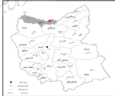
شکل 10: نقشه قرارگیری شهرستان جلفا