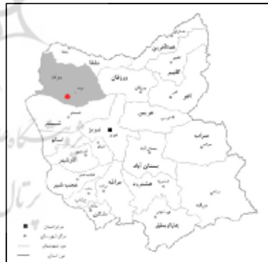
شکل 6: نقشه شهرستان مرند