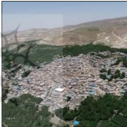
شکل 16: قرارگیری روستا در پهنه کوه