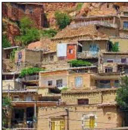
شکل 12: خانه های پلکانی روستا