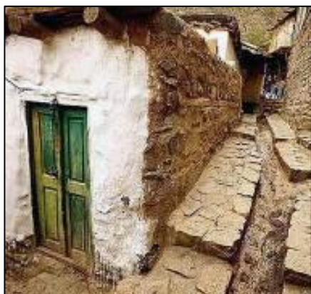
شکل 13: معابر شیبدار روستا