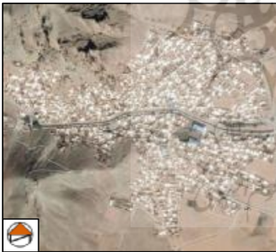
شکل 7: عکس هوایی گلین قیه

این روستا در شمال غربی استان و جنوب غربی شهر مرند واقع شده است. روستای گلین قیه در فاصله 5 کیلومتری از جاده مرند-جلفا قرار دارد. بر اساس سرشماری سال 1395 جمعیت این روستا شامل 1990 نفر، 682 خانوار و 641 واحد مسکونی می‌باشد. براساس اطلاعات جمعیت‌شناسی، این روستا دارای 2/92 بعد خانوار و 89/79 درصد نرخ باسوادی و 3/15 درصد نرخ بیکاری است (طرح هادی روستای گلین قیه، بنیاد مسکن انقلاب اسلامی استان آذربایجان شرقی).