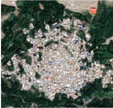
شکل 15: عکس هوایی گنبرف (Google Map)