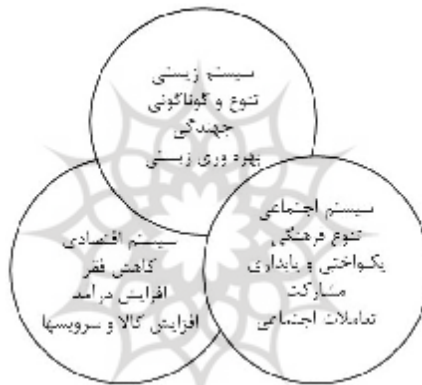
شکل 1: رویکردهای توسعه پایدار (18: Jaarsma. Langevelde. Baveco . Eupen. Arisz, 2007).

توسعه به این نتیجه رسیده‌اند که باید از طریق رویکردهای اجتماعی، برنامه‌های مشارکتی در مناطق روستایی و مبارزه با فرآیندهای تاثیر گذار بر فقر نواحی روستایی از طریق راهبردهای بهبود شرایط زندگی به صورت ساختارهای اجتماعی و فرهنگی، اقتصادی و مدیریتی کاهش بازخوردهای منفی محیطی و ایجاد صنایع سبز و حمایت از گروه‌های بومی محلی و غیره بتوانند فعالیت این عامل مخرب را در نواحی روستای کاهش دهند (11: Shamsudim ModArshad, 1997). در حال حاضر بسیاری از برنامه‌های کشورهای در حال توسعه حول محور توسعه پایدار می باشد، بر این اساس برنامه‌ریزان در این جوامع از طریق الگو برداری شیوه‌های کشورهای توسعه یافته می کوشند تا از طریق رویکردهای توسعه پایدار تصویر 7، حفظ و ارتقای محیط را در سطوح ملی، منطقه‌ای و محله فراهم نمایند (18: Jaarsma. Langevelde. Baveco . Eupen. Arisz, 2007).