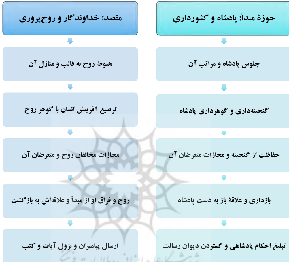
شکل شماره ۸: نمودار کلان‌استعاره خداوندگاری به‌منزله کشورداری

اکنون می‌توان مطالب به‌دست‌آمده را در نمودار کلان‌استعاره خداوندگاری و کشورداری ترسیم کرد. همچنان‌که دیدیم پنج خرداستعاره ذیل این کلان‌استعاره می‌گنجد. البته بدان معنا نیست که نمی‌توان خرداستعاره‌های دیگری را بدان افزود؛ اما در بخش‌های مطالعه‌شده، این استعاره‌ها برجسته‌تر بوده است: