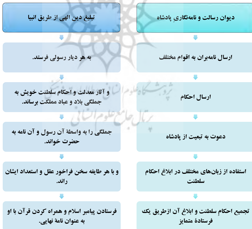
شکل شماره ۷: نمودار نگاشت تبلیغ دین به منزله‌ تشکیلات اطلاع‌رسانی شاه