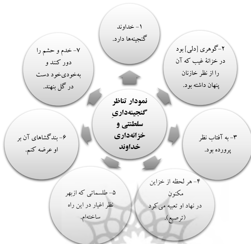
شکل شماره ۴: نمودار حوزه مقصد: موضوع انتزاعی خزانه‌داری خداوند