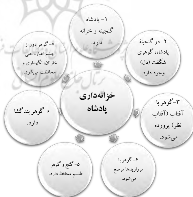
شکل شماره ۳: نمودار حوزه مبدأ، بر پایه شواهد ذکر شده

باتوجه‌به گزاره‌ها و توضیحات ارائه‌شده، می‌توان نمودارهای مبدأ و مقصد را به‌صورت شکل‌های زیر نشان داد.