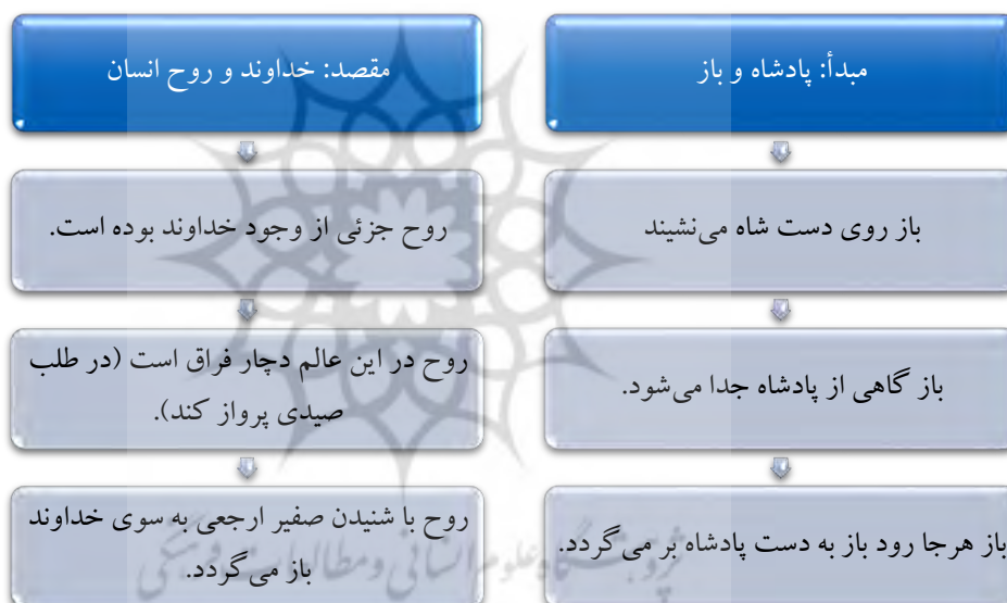
شکل شماره ۶: نگاشت پرورش روح به منزله پروردن باز شکاری