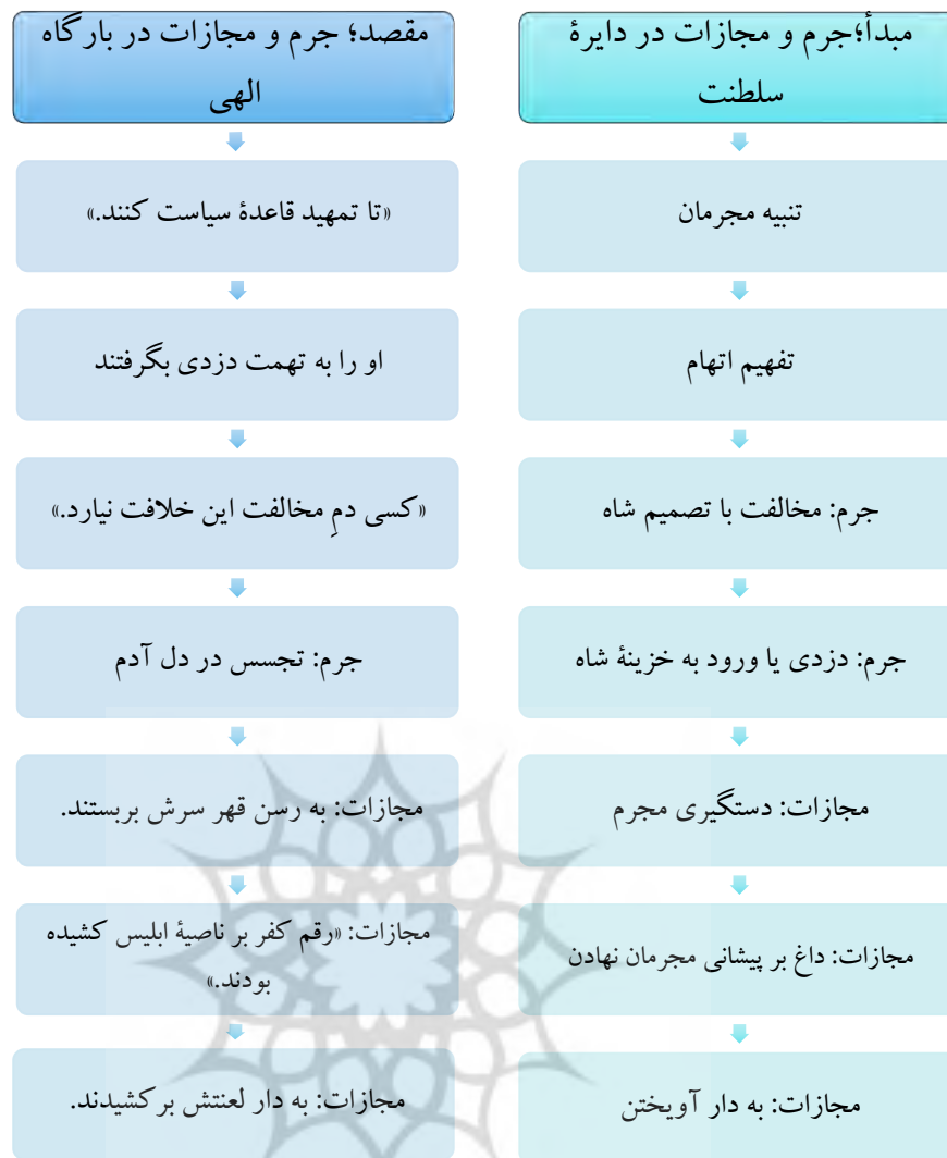
شکل شماره ۵: جرم‌های ابلیس و روش‌های مجازات ابلیس