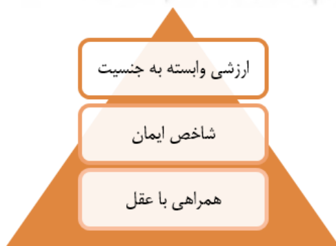
شکل ۱. توسعه مفهوم حياء در روایات

در دسته اول می‌توان به روایاتی اشاره نمود که مفهوم حياء را با بحث عفت و زنان مرتبط می‌داند. این روایات حياء را بیشتر مختص زنان عنوان می‌کند، از این رو در برخی از آنها مرز بین عفت و حياء چندان مشخص نشده است. در دسته دوم، حياء را با ایمان و اعتقاد انسان به خداوند مرتبط دانسته و لازمه ایمان را وجود حياء در انسان عنوان کرده‌اند. در این دسته احادیث، ارتباط تنگاتنگ حياء و باور و اعتقاد فرد مورد توجه قرار گرفته و تاکید شده که هر چه حياء در فرد بیشتر شود، ایمان نیز در او بیشتر می‌شود. در دسته سوم احادیثی قرار دارد که در آن حياء یکی از ویژگی‌های انسان به شمار می‌رود و در سایر موجودات وجود ندارد و یا حداقل به این شکل دیده نمی‌شود. یکی از بیانات خاص در این حوزه، بیان امام صادق (ع) در توحید مفضل است که صراحتاً در آن اختصاص حياء به انسان اشاره شده است (ابن عمر جعفی، ۱۳۷۹، ۱۰۳). این انحصار حياء برای انسان، همراهی آن را با عقل نیز در بیان احادیث اجتناب‌ناپذیر ساخته است، چه آن که قدرت تعقل نیز خاص انسان بوده و در سایر موجودات وجود ندارد و یا لاقط بدین شکل دیده نمی‌شود.