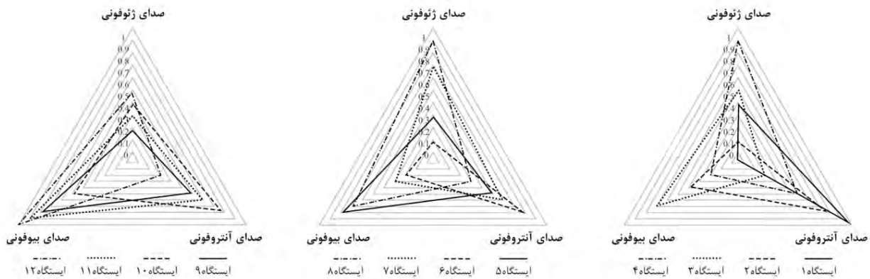
شکل ۵. ترکیب صداهای درک شده در موقعیت‌های نظرسنجی Fig. 5: Composition of sounds perceived in research situations

رد شده و با اطمینان ۹۵٪ می‌توان گفت رابطه معنی‌داری بین دو متغیر وجود دارد. در این حالت با توجه به مقدار ضریب همبستگی و علامت آن می‌توان گفت، اگر ضریب همبستگی مثبت باشد رابطه بین دو متغیر مستقیم است؛ یعنی با افزایش یکی دیگری نیز افزایش می‌یابد و اگر منفی باشد بدین معنی است که با کاهش یکی دیگری افزایش می‌یابد. مقدار ضریب همبستگی پیرسون با کمک رابطه زیر به دست می‌آید: