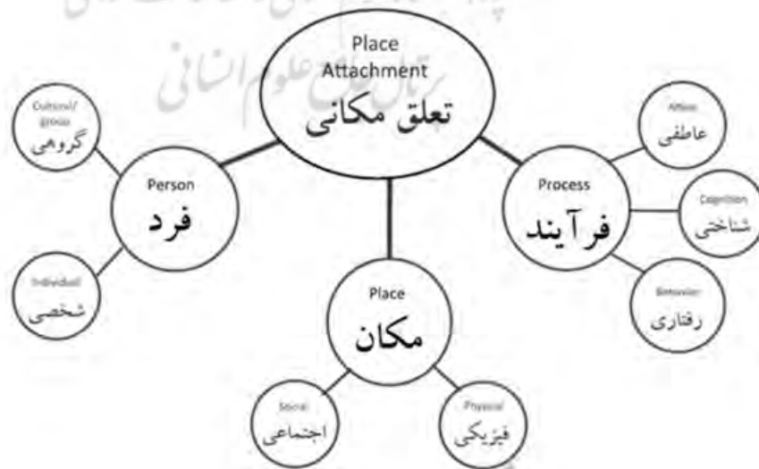
شکل ۱. جوانب و ابعاد تعلق مکان (Source: Scannell & Gifford, 2010) Fig. 1: Aspects and dimensions of place belonging (Source: Scannell & Gifford, 2010)

تعلق مکانی دارای جوانب و ابعاد گوناگونی است که محققین مختلف به آن اشاراتی داشته‌اند. این جوانب و ابعاد حس تعلق را در قالب نمودار شکل ۱ بیان کرده است.