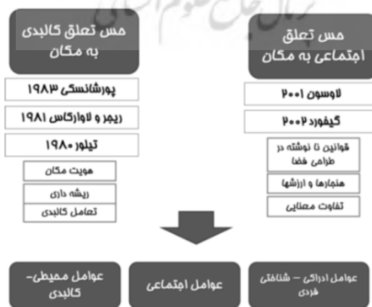
شکل ۲. ابعاد مختلف حس تعلق (Source: Gifford et al., 2002) Fig. 2: Dimensions of sense of belonging (Source: Gifford et al., 2002)

مکان منظر صوتی بر کیفیت ادراک ما در ارزیابی منظر صوتی مؤثر است و در این میان پیاده‌روی صوتی نقش بسزایی در ادراک منظر صوتی و احساس تعلق به مکان دارد (Nilsson, 2007). بر این اساس، در درک منظر صوتی یک مکان، رابطه بین ادراک محیط صوتی و زمینه و بستر محیطی بسیار بااهمیت است (Jeon & Hong, 2015). ارزیابی افراد از منظر صوتی، بیش از آن که تحت تأثیر خصوصیت‌های آکوستیکی باشد، با مؤلفه‌های شناختی در ارتباط است (Davies et al., 2013) از همین رو است که انواع منابع صوتی در رابطه با مؤلفه‌های ادراکی صدا قرار می‌گیرند (Axelsson et al., 2010). همچنین طول مدت مواجهه با صدا نیز می‌تواند بر درک منظر صوتی اثرگذار باشد (Kang, 2006). صدای محیط می‌تواند واکنش‌های ذهنی ایجاد کند که ممکن است مناسب، خوشایند، آشنا و مناسب برای ارتباط با محیط باشد. چنین صفات و معانی تأثیر عمیقی بر ارزیابی منظر صوتی می‌گذارد (Cain et al., 2013). البته سنجش و ارزیابی‌های ذهنی منظر صوتی، به‌طور قابل توجهی وابسته به نوع منبع صوتی است (Ren et al., 2018). ترجیحات