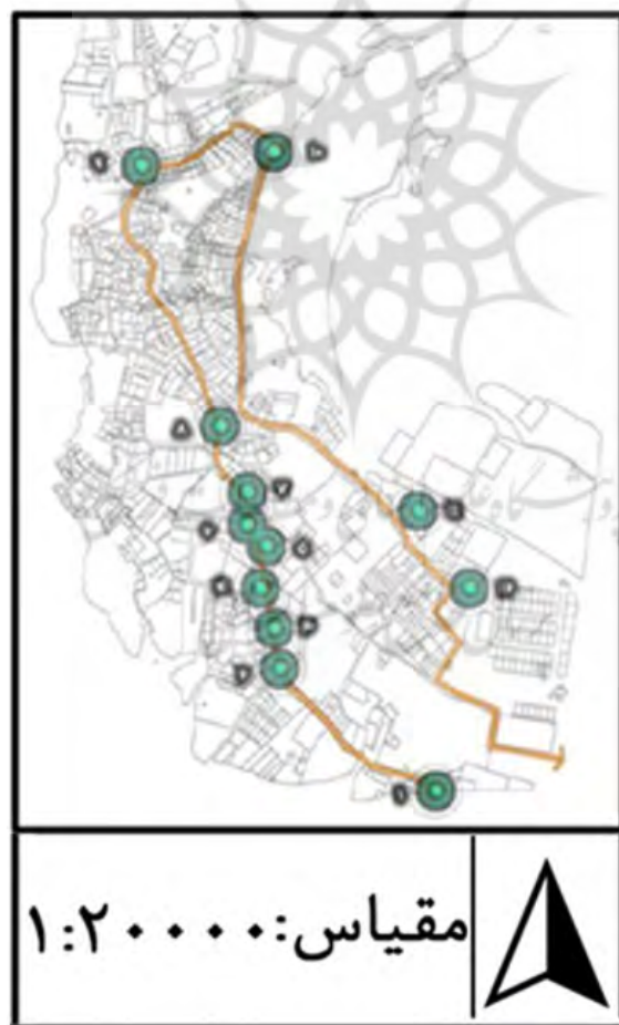
شکل ۴. نقاط ویژه صدایی در محله فرحزاد Fig. 4: Sound special points in Farahzad neighborhood

با بررسی نقشه‌های ترسیم‌شده توسط پرسش‌شوندگان ۴۹ نقطه صدایی متمایز در محله شناسایی شد که با توجه به میزان تکرار در افراد مختلف در نهایت ۱۲ نقطه شاخص در محدوده شناسایی گردید. سپس از طریق نرم‌افزار (NIOSH SLM (Version 1.2.5) به سنجش میزان سنجه فیزیکی صوت- L_{Aeq} (تراز معادل صوت