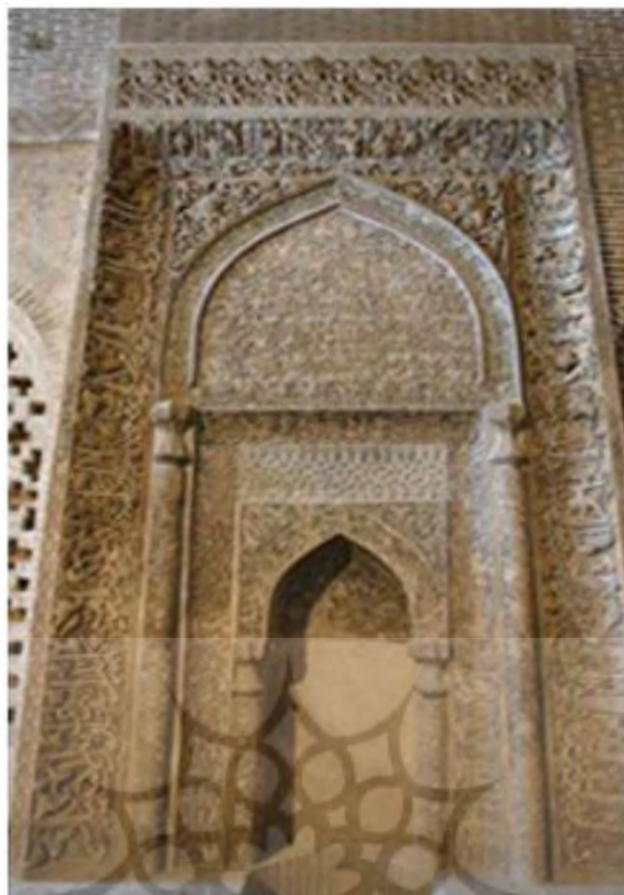
تصویر ۲- کتیبه محراب مسجد جامع اصفهان.

در دو طرف این مدخل، دو ستون سنگی و مرمری وجود دارد که شامل نقوش برجسته‌ای است و عبارات دعای نادعلی به خط ثلث بر آن نوشته شده‌است؛ ستون سمت راست: «ناد علیا مظهر العجائب تجده عوناً لک فی النوائب» ستون سمت چپ: «کل هم و غم سینجلی بولایتک یا علی یا علی یا علی» (نصرتی، ۱۳۸۰: ۲۹؛ هایده، ۱۳۸۰: ۳۳) سردر باب‌الدشت: سر در باب‌الدشت در انتهای راهرویی قرار دارد که قدمت آن به عهد سلجوقیان می‌رسد و در قسمت جنوب‌غربی مسجد قرار دارد و دارای چهلستون شاه‌عباسی، منبت‌کاری و طاق‌های آجری است. بر کتیبه سردر آیه ۱ تا ۳ سوره جمعه حک شده‌است. دو کتیبه دیگر نیز موجود است که آیه ۱۲۷ سوره بقره بر آن حک شده‌است (نصرتی، ۱۳۸۰: ۳۰؛ قاسمی سیجانی، قنبری شیخ شبانی، ۱۳۹۶: ۵۸).