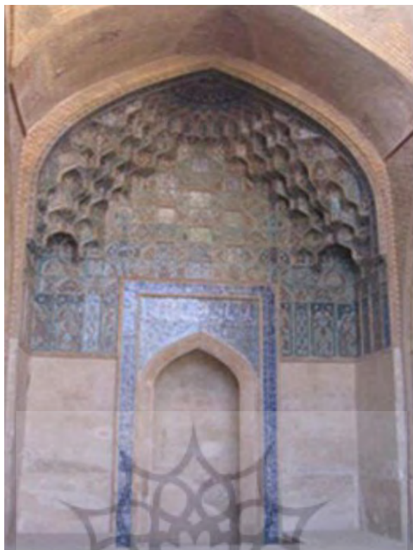
تصویر ۳- کتیبه سردر مسجد جامع اصفهان.

سردر جنوبی: در غرب گنبد خواجه نظام‌الملک یک در قدیمی دیگر وجود دارد که بر دو لنگه آن به خط ثلث بر زمینه لاجوردی «قال الله تبارک و تعالی و ان المساجد لله فلا تدعوا مع الله احدا» و آیه ۱۸ سوره جن حک شده است (جبل عاملی، ۱۳۹۱: ۴۴) نیز برخی آیات حک شده بر روی کاشی‌های تزئینی مسجد بوده است که به وسیله کاشی‌کاری، خطوط ثلث (علم‌بیگی، ۱۳۹۱: ۳۵) و مقرنس‌های آجری تزئین شده و صورت اصلی خود را حفظ کرده است. در این قسمت به وسیله خطوط کوفی کتیبه آیه ۱۸ و بخشی از آیه ۱۹ سوره آل عمران نوشته شده است. محراب ایوان شاگرد تماماً از سنگ مرمر ساخته شده و در دیوار جنوبی واقع شده است که آیه ۵۴ سوره مائده بر اطراف آن حک شده است. اطراف و بالای آن کتیبه‌ها و الواح مختلف حک شده است. اطراف محراب بر کاشی‌های کوچک به خط کوفی صلوات و درود بر چهارده معصوم حک شده، اما تنها شش لوح آن باقی مانده و مابقی مفقودند. دیوار شرقی که متعلق به ایوان کوچک واقع شده در ضلع شرقی ایوان شاگرد است، به وسیله خطوط گچ‌بری که در حاشیه آن انجام شده (اسماء‌الله، سوره حمد، اخلاص و آیه الكرسی نوشته شده است (پورنادری، ۱۳۹۴: ۱۳۰). متن اصلی که در صفه‌ای بزرگ گچ‌بری شده، شامل مربع و دایره‌های کوچک است که اسامی خداوند، نام محمد، ابوبکر، عمر، عثمان و علی در آن‌ها به خط کوفی حک شده است. در بعضی از دایره‌ها نام پیامبر و خلفای راشدین با هم نوشته شده و در بعضی دیگر عبارت «لا اله الا الله محمد رسول الله علی ولی الله» گچ‌بری شده است (همان).