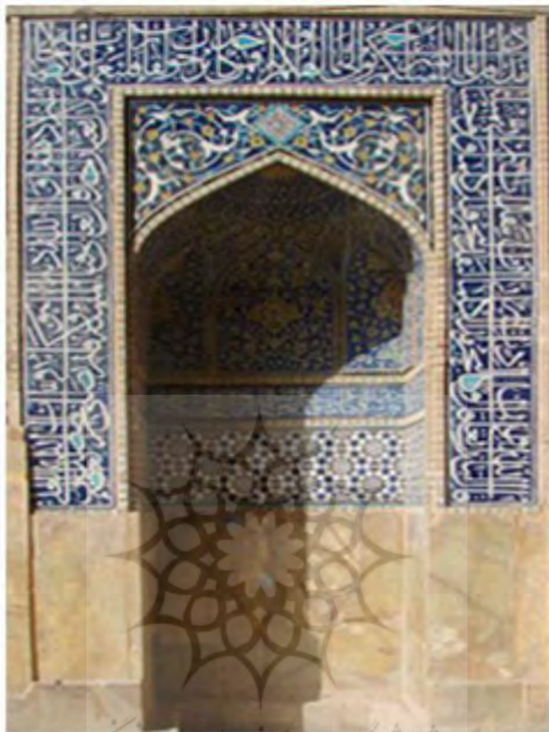
تصویر ۱- کتیبه قرآنی ورودی مسجد جامع اصفهان.

کتیبهٔ محراب شرقی شامل دو جزء می‌شود. در حاشیه (ان‌الله و ملائکه یصلون علی‌النبی یا ایها الذین آمنوا صلوا علیه و سلموا تسلیماً) حک شده و سپس صلوات بر دوازده امام همانند محراب غربی و در آخر هم سال اثر ۹۱۸ هـ ق نوشته شده است (قاسمی سیجانی، قنبری، شیخ شبانی، ۱۳۹۶: ۵۷).