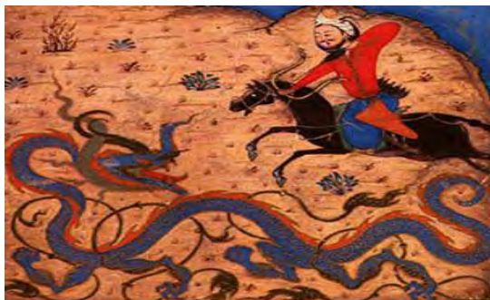
(شکل ۹) نگاره‌ای از نسخه شاهنامه

هنگامی که با نگاره‌های ایرانی برخورد می‌کنیم با حجم عظیمی از رنگ‌های خالص روبه‌رو می‌شویم و هیچ کمبودی از نظر رنگ احساس نمی‌شود و این رنگ‌ها خالص راه به سمت بی‌رنگی می‌برد و این بی‌رنگی با هدف هنر ایرانی که رسیدن به فراسوست هم‌خوانی دارد (کربن، ۱۳۹۳: ۱۹۶). یکی از نمونه‌های عالی رنگین نگاره «شمس و شمات و پریان» از «کتاب سمک عیار» مربوط به عصر سلجوقیان است (شکل ۸). رنگ تنه درختان بنفش و برگ‌های دو درخت طرفین با طلا رنگ‌آمیزی شده و برگ‌های درخت وسطی سبز و آبی و زیتونی است. پریزاد سمت چپ جبهه‌ای سبز پوشیده و پیراهنش به رنگ زرشکی و نقوش طلایی است. پیراهن بلند پریزاد سمت راست نیز به رنگ صورتی است. رنگ زمینه‌ی نهر آبی خاکستری است و باید گفت در این نگاره دو زمینه آبی خاکستری و روناسی زمینه‌ی اصلی را تشکیل می‌دهند (ضیاءپور، ۱۳۵۳: ۶۹-۶۸).