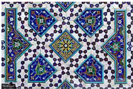
(شکل ۶) بخشی از کاشی مسجد گوهرشاد دوره تیموری

سبز و سفید که به ترتیب نماد آسمان، طبیعت و نور الهی هستند با هم در آمیخته و بر ملکوتی بودن مساجد می‌افزایند (عناقه و دیگران، ۱۳۹۱: ۱۸۲). در مسجد گوهرشاد (شکل ۵) رنگ فیروزه‌ای گنبد با وسعت زیاد در جوار گنبد طلایی حرم امام رضا (ع) بر زیبایی فضا افزوده است. سفیدی خط نوشته‌ها بر روی آبی لاجوردی تضادی چشم نواز به وجود آورده است. در مجموعه‌ی گوهرشاد رنگ غالب آبی است که خود رنگی آرام‌بخش و مناسب برای روحیه زائران است. (شکل ۶) (مصدقیان، ۱۳۹۱: ۱۵).