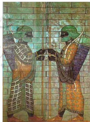
(شکل ۳) کاشی منقوش گود و برجسته، سربازان جاویدان

کشف شده از شوش، موزه ملی ایران (دوره هخامنشی)