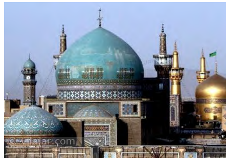
(شکل ۵) مسجد گوهرشاد. دوره

با شروع تفکر عرفانی در قرن ششم خصوصاً اندیشه‌های مبتنی بر نور و رشد و توسعه آن در قرن‌های بعد خصوصاً شکوفایی آن در دوره‌ی صفویه که امتزاجی کم نظیر از تشیع، عرفان و اشراق را به وجود آورد.