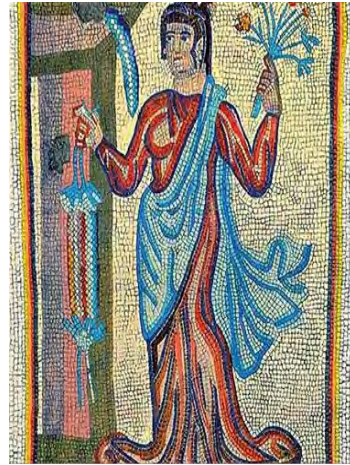
(شکل ۲). نقش موزائیکی بانو با دسته گل

(مربوط به سده پنجم پیش از میلاد در موزه لوور)