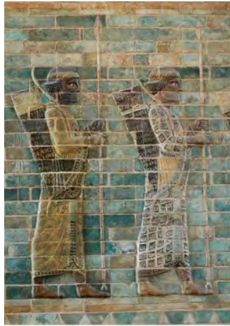
(شکل ۱). کاشی لعابدار شوش با نقوش سربازان جاوید

(مربوط به سده پنجم پیش از میلاد در موزه لوور)