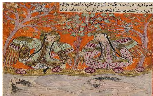
(شکل ۸) شمس و شمات و پریان در کتاب سمک عیار