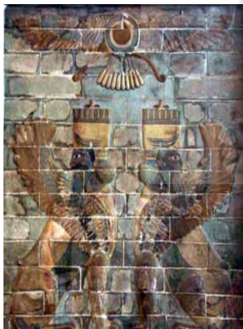
(شکل ۴) کاشی منقوش گود و برجسته، شیر مردان بال

هنر سفالگری در دوره شکوفایی امپراتوری هخامنشی وارد مرحله‌ای از شکل، نقش‌ها و رنگ‌های گوناگون شد. در این دوره، هنر کاشی‌پزی و کاشی‌کاری نیز پدید آمد و کاشی‌های بلوکه‌شده گود و برجسته با نقاشی و لعاب‌های رنگی به رنگ‌های سبز متمایل به آبی، قهوه‌ای، مشکی و زرد سیر ارزش‌های هنری بسیار بالایی برای قطعه‌های بلوکه شده گود و برجسته کاشی به‌وجود آورد. با قرار دادن قطعه‌های کاشی بلوکه در نزدیکی هم، تابلوهای بسیار شگرفی چون: گل‌های رُزاس، سرباز و سربازان جاویدان، شیرمردان بالدار، شیر بالدار و شاخدار (گریفن) و پاره‌ای دیگر در شوش و ... به وجود آمد (شکل ۳ و ۴) (زمرشیدی ها، ۱۳۹۱: ۵۱)