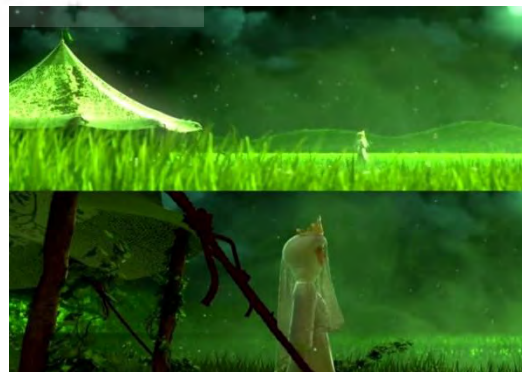
(شکل ۱۵) تصاویری از انیمیشن شاهزاده رم