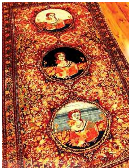
تصویر ۱۹. تصویر زن اروپایی بر روی جعبه فلزی آبنبات