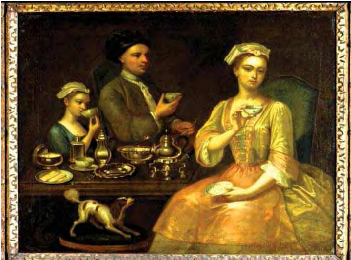
تصویر ۱۵. نقاشی با عنوان: خانواده سه نفره، اثر نقاش انگلیسی، ۱۸۲۷ م، موزه ویکتوریا و آلبرت، مأخذ: URL:3