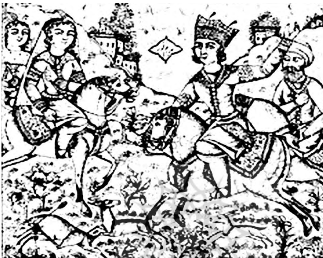
تصویر ۱. چاپ سنگی بهرام و آزاده، مأخذ: مرادی شورچه، افشاری، ۱۳۷۸، ۴۵.

فعالیت‌های اجتماعی آنان نیز از دیگر عوامل زمینه‌ساز حضور زنان به عنوان سوژه‌های هنرمندان تصویرگر دوره قاجار به شمار می‌روند.