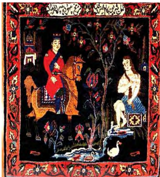
تصویر ۴. قالیچه نگاره خسرو و شیرین

میان گروهی از مشهورترین پادشاهان اساطیری و تاریخی ایران و افراد صاحب‌نام و مشهور جهان دانست. مقایسه تصویر تک نگاره چاپ سنگی آرمیدخت و خواهرش پوراندخت در نامه خسروان جلال‌الدین میرزا (تصویر ۱۰) نشان از وجود شباهت‌هایی میان تصاویر این شخصیت‌ها در قالی و چاپ سنگی دارد.