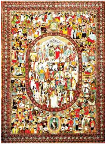
تصویر ۸. قالی مشاهیر