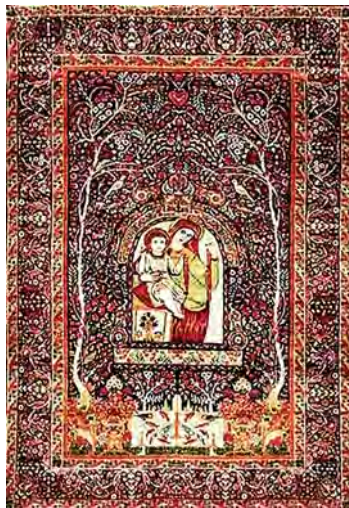
تصویر ۱۸. قالی تصویری کرمان.