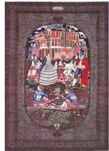
تصویر ۱۶. قالی تصویری کرمان.

هنر غربی بر قالی‌های تصویری دوره قاجار، ورود مستشاران، جهانگردان و تاجران فرانسوی، ایتالیایی، انگلیسی و ... به ایران بود که نقاشی‌های چاپ‌شده، کارت‌پستال و گوبلن‌های فرنگی را با خود به ایران آورده و به دربار قاجار هدیه می‌دادند. لذا یکی دیگر از فرش‌هایی که در دوره قاجار و در شهر کرمان و به استناد کتیبه موجود در قالی به دست استاد علی کرمانی بافته شده است، قالی با نام رقص الهه است و در ابعاد ۳۰۶ × ۲۱۰ سانتی‌متر و با چله‌های پنبه‌ای و خامه پشمی در سال ۱۲۹۰ ه.ق بافته شده است و متعلق به یک مجموعه خصوصی هست (تصویر ۲۱). طرح این قالی برگرفته از طرح یک گوبلن فرانسوی است (تصویر ۲۲). «گوبلن در کارگاه جولز رومن بافته شده است و طرح آن برگرفته از نقاشی الکساندر اولبکسی با نام «رقص یک نف و یک ساتیر» است. اصل نقاشی مربوط به سال ۱۶۸۴ یا ۱۶۸۶ میلادی است که با فن رنگ‌وروغن کار شده است (تصویر ۲۳). در عصر ناصرالدین‌شاه، یک کپی از این پرده گوبلن در کاخ گلستان آویزان بود که احتمالاً این‌گونه از فرش‌ها از آن بهره برده‌اند. در این گوبلن تصویر زن جوانی (نمف) را نشان می‌دهد که حلقه‌ای از گل در دست دارد و در حال رقص است» (زکریایی کرمانی و همکاران، ۱۳۹۲، ۱۵). در بالای سر نمف سه فرشته بالدار حضور دارند که یکی در حال چیدن خوشه‌های گل و انگور است، دیگری سبزی گل بر سر دارد و سومین فرشته در حال نواختن دایره زنگی است. نکته مهم در مورد این قالی، سعی هنرمند در وفاداری به نمونه گوبلن است. به عبارتی دیگر، هنرمند علاوه بر ایجاد تغییراتی در متن تصویر و ایرانی ساختن این نمونه، در برخی جزئیات به اصل وفادار بوده است.