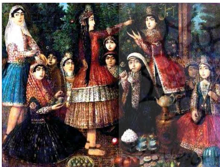
تصویر ۱۳. نقاشی اسماعیل جلایر با عنوان: زنان درباری نورسماور، مأخذ: پنجه‌باشی، ۴۵۹، ۱۳۹۵