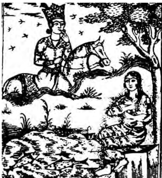
تصویر ۵. چاپ سنگی خسرو و شیرین، ۱۲۶۸ ه.ق.