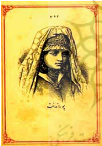
تصویر ۱۰. چاپ سنگی تصویر آرمیدخت و پوراندخت، مأخذ: شیرازی و همکاران، ۱۳۹۴، ۶۴ و ۷۴