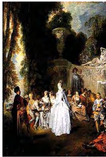
تصویر ۱۷. نقاشی تعطیلات ونیزی اثر ژان آنتوان واتو