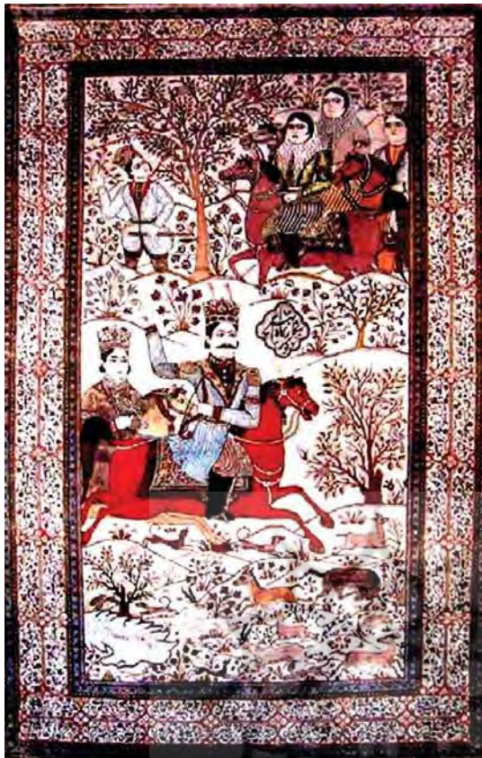
تصویر ۳. قالی تصویری بهرام گور، مأخذ: همان، ۷۵