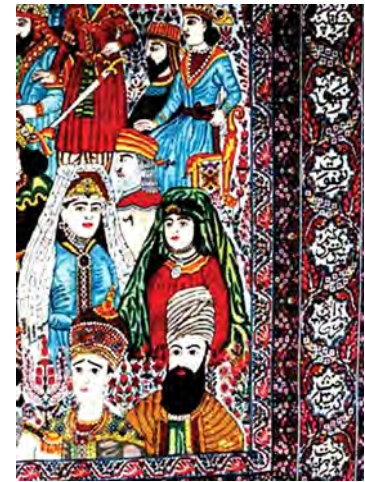
تصویر ۹. تصویر دو شاه بانوی ساسانی در قالی مشاهیر

این دوره دیده شده است (تصویر ۱۳). جدول شماره ۲ جمع‌بندی اطلاعات کیفی قالی‌های حاوی تصاویر زنان ایرانی را نشان می‌دهد. ۴ نمونه از ۶ قالی بررسی شده متعلق به جغرافیای قالی کرمان می‌باشد و ۲ نمونه دیگر نیز قالی‌های با موضوع مشابه و مربوط به شهر کاشان هستند. مضمون تصاویر و صحنه‌آرایی عناصر تصویر در تمامی نمونه‌ها برگرفته از ادبیات داستانی، حماسی و غنایی ایرانی است. برخلاف قالی‌هایی با تصاویر زنان فرنگی که بر جنبه‌های واقعی، عینی و روزمره زندگی زنان و تعاملات اجتماعی آنان می‌پردازند در نمونه‌های ایرانی شخصیت‌های اساطیری، تاریخی و غایب از نظرها سوژه اصلی نقش‌پردازی هنرمندان شده‌اند. در دو نمونه قالی کاشان با موضوع شکار بهرام‌گور فضاسازی صحنه به‌واسطه حضور عناصر گیاهی، نوع