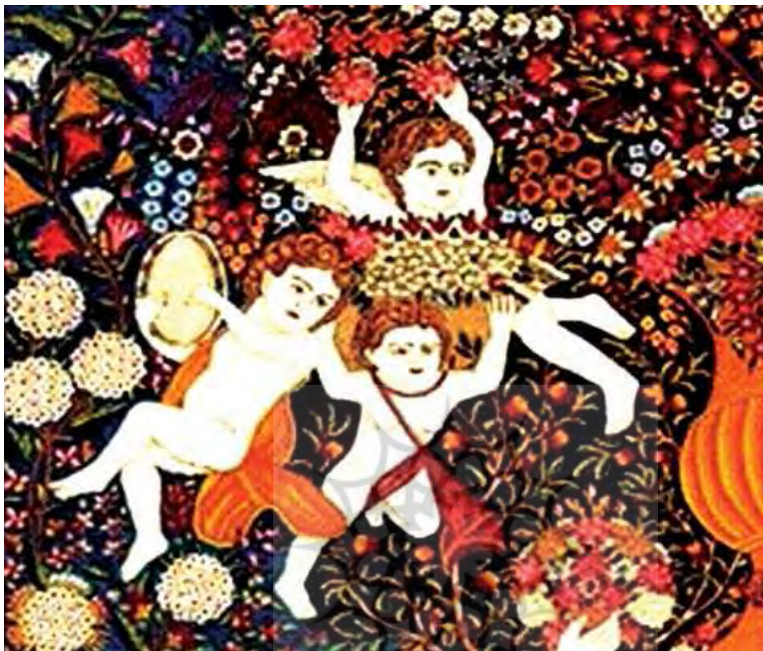
تصویر ۲۴. هم‌نشینی طرح و رنگ قالی کرمان با عناصر تصویری فرهنگی ماآبانه بخشی از قالی تصویر ۲۱.