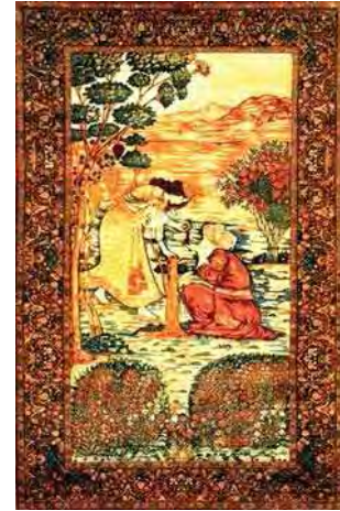
تصویر ۶. قالی با تصویر شیخ صنعان و دختر ترسا