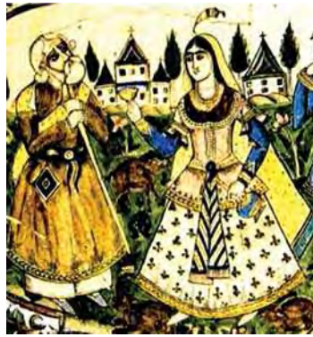
تصویر ۷. قطعه کاشی با تصویر شیخ صنعان و دختر ترسا. اصفهان؟، مأخذ: جباری و مرآتی، ۱۳۹۲، ۶۱