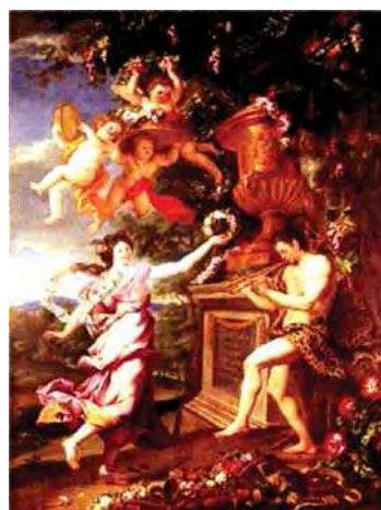
تصویر ۲۳ نقاشی رنگروغن اثر الکساندر اولبکسی