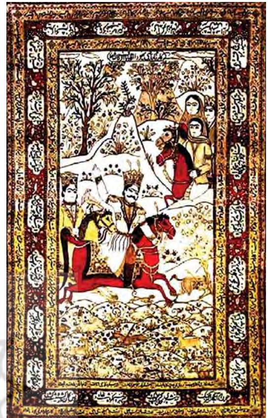
تصویر ۲. قالی تصویری شکارگاه بهرام گور، مأخذ: آهنی و همکاران، ۱۳۹۴، ۷۳

قالی شیخ صنعان و دختر ترسا با مضمونی عاشقانه در منطقه راور کرمان در ابعاد ۱۵۸ در ۲۰۱ سانتی متر و در رجشمار ۹۰ بافته شده است (تصویر ۶). این قالی با تار و پود پنبه‌ای و خامه ابریشم، یکی از نفیس‌ترین قالی‌های تصویری عصر قاجار به حساب می‌آید که در مجموعه فرهنگی و تاریخی نیاوران نگهداری می‌گردد. قالی طرحی از داستان شیخ صنعان و دختر ترسا را نشان می‌دهد که برگرفته از کتاب منطق الطیر عطار است. هنرمند در بازنمایی این صحنه از داستان، شیخ را در مرکز تصویر با حالتی زار و زانو زده در برابر دختر ترسا که نمادی از آیین کفر است در حال نوشیدن شراب و ارتکاب گناهی بزرگ به نمایش گذاشته است. در این قالی ادغام و درهم‌آمیختگی هنر تصویرسازی فرنگی مآبانه در بازنمایی تصاویر و حالات انسانی و هنر تصویرگری ایرانی در تزیینات و ترکیب کلی طرح از طریق استفاده از آرایه‌های اسلیمی و ختایی در متن و حاشیه قالی مشهود است. نکته اوج داستان شیخ صنعان و دختر ترسا که همانا صحنه شراب نوشی شیخ به دست دختر ترسا است همواره مورد توجه هنرمندان مختلف در آفرینش‌های هنری خود قرار گرفته است. (تصویر ۷).