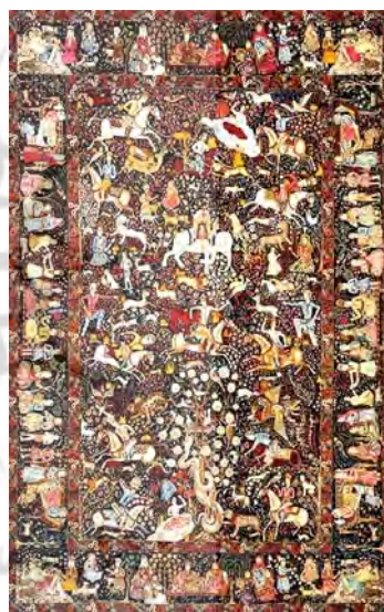
تصویر ۱۱. قالی تصویری - داستانی، مأخذ: ملول، ۱۳۸۴، ۱۴۱

تصویرپردازی از زنان فرنگی، نسبت به شخصیت‌های تاریخی ادبیات ایران بویژه آن‌هایی که هویت غیر مسلمان دارند نیز در حال گسترش بوده است.