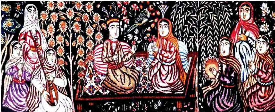
تصویر ۱۲. بخشی از قالی تصویری، داستان مجلس خسرو پرویز و مهین بانو، مأخذ: همان، ۱۳۷