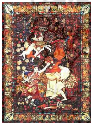
تصویر ۲۱. قالی تصویری رقص الهه، مأخذ: ملول، ۱۳۸۴، ۱۳۱