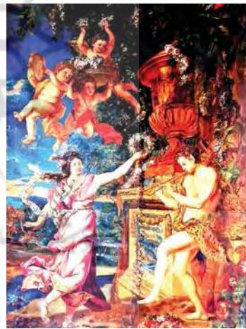
تصویر ۲۲. گولبن فرانسوی، مأخذ: زکریایی کرمانی و همکاران، ۱۳۹۲، ۱۵

جدول شماره ۳، جمع‌بندی یافته‌های مربوط به نمونه قالی‌های تصویری منقوش به زنان فرنگی را نشان می‌دهد. نتایج بررسی‌ها حاکی از آن است، بیشتر این قالی‌ها صرفاً بازآفرینی دوباره از یک تصویر جافتاده و رواج یافته در جامعه غربی هستند که از روی تصاویر دیگر هنرها همچون چاپ سنگی، عکاسی، کارت‌پستال‌ها، جعبه‌های فلزی و یا تابلوهای نقاشان غربی توسط طراحان قالی الهام گرفته شده و توسط بافندگان ماهر بافته شده‌اند. جمع‌بندی اطلاعات ۵ نمونه از قالی‌های بررسی شده در این جدول نشان می‌دهد، ۴ نمونه از این قالی‌ها در جغرافیای قالی