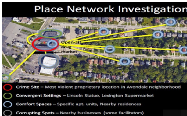
تصویر ۵. شمایی گرافیکی از «شبکه مکان‌های واقعی» در وقوع جرم. مأخذ: Herold et al, 2017, 26.