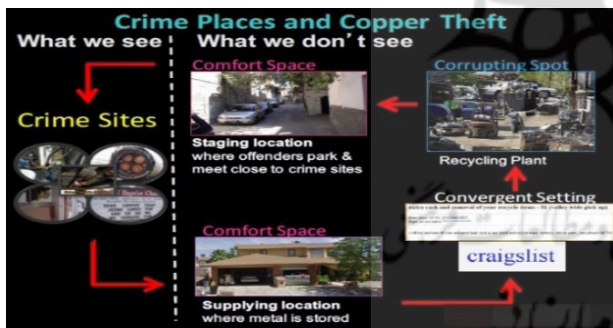
تصویر ۴. شمایی گرافیکی از اتصالات «شبکه‌های عینی مکانی» الزامی در وقوع جرم. مأخذ: Herold et al., 2017, 14.

و وضعی ۵۷ و برنامه‌های مرکب و بازتلفیقی ۵۸ طبقه‌بندی کرد (UNODC, 2010, 12-15). توجه به مقوله مدیریت مکان در سال‌های پایانی دهه (۱۹۹۰) میلادی، خود در امتداد رشد تکنیک‌های پیشگیری از جرم از جمله تکنیک‌های ناظر بر رویکرد موقعیت‌محور از جرم قرار داشته است (Cornish & Clarke, 2003, 89-90). از نظر «کلارک» ۵۹ ، «پیشگیری موقعیت‌محور» فراتر و دامن‌دارتر از «CPTED» بوده؛ چرا که تمام محدوده محیط و اشیاء درگیر با جرم را درگیر کرده و از این رو تمامی «سیستم حقوقی و مدیریتی» همانند «راه‌حل‌های طراحی» واجد اهمیت هستند (صالحی، ۱۳۸۷، ۱۵۰). پیشگیری موقعیت‌محور از جمله رویکردهای نوین در این حوزه و مرتبط با ویژگی‌های فیزیکی و نقش فرصت‌های فیزیکی موقعیت، مکان و دارای ارتباط با شرایط برآمده در دامنه تصمیمات و انتخاب‌های مهاجمان در موقعیت جرم است (Clarke, 1980, 449, 460). در واقع، فنون و روش‌های ناظر بر «پیشگیری وضعی یا موقعیت‌محور» ۶۰ با تأکید بر همین «مدیریت محیط» و فرصت‌های مجرمانه به نسبت سایر فرصت‌ها پدید آمده‌اند (مقیمی، ۱۳۹۶، ۱۵۹)؛ (Benson, Madensen & Eck, 2009, 183). به طوری که به دنبال آن هستند که چرا بعضی از فرصت‌های مجرمانه