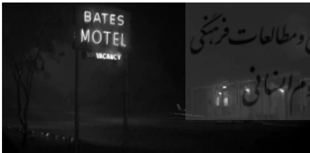
تصویر ۱. متل ارزان قیمت، مکان جرم قتل در فیلم کلاسیک ارزشمند «روانی» اثر آلفرد هیچکاک. مأخذ: Hitchcock, 1960.