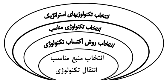
شکل ۱. انتخاب‌های تکنولوژیک یک بنگاه اقتصادی

تکنولوژی مناسب تاثیر قابل توجهی بر موفقیت فعالیت‌های بعدی و اثربخشی بکارگیری تکنولوژی دارد. اهمیت این مسأله تا به حدی است که نه تنها دارای نتایج اقتصادی قابل توجهی است بلکه با توجه به نقش استراتژیک آن در جهان امروز، می‌تواند منجر به شکست یا موفقیت کامل یک بنگاه اقتصادی شود. تصمیم‌گیری در خصوص انتخاب تکنولوژی سطوح متفاوتی دارد که در این راستا می‌توان به انتخاب تکنولوژیهای استراتژیک در سطح بنگاه اشاره کرد. همچنین می‌توان به تصمیم‌گیریهای تاکتیکی نظیر انتخاب تکنولوژی مناسب، انتخاب روش مناسب اکتساب، و انتخاب منبع مناسب انتقال تکنولوژی اشاره داشت (شکل ۱). ارزیابی تکنولوژی در اصل، به دلیل بررسی آثار منفی احتمالی آن دارای اهمیت می‌باشد. بدین صورت که ضمن کاهش پیامدهای منفی تکنولوژی بایستی در اندیشه حد اکثر نمودن آثار مثبت آن و نیز توسعه متناسب با شرایط پیاده‌سازی آن همت ورزید. بنا براین محور ارزیابی می‌تواند بررسی ویژگیهای ذاتی و یا بررسی مشکلات اجتماعی ناشی از کاربرد یک تکنولوژی باشد [۷]. به هر حال، ارزیابی و انتخاب تکنولوژی مناسب تحت تاثیر عواملی نظیر نقطه نظرات تصمیم‌گیرندگان کلیدی، و شرایط ملی و بنگاهی است که ممکن است گزینه‌ها بر اساس برخی شاخص‌ها مطلوب و بر اساس برخی دیگر نامطلوب ارزیابی شوند.