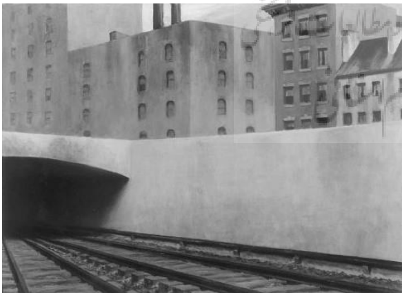
شکل ۳. نزدیک‌شدن به یک شهر از ادوارد هاپر (اسلاتر، ۲۰۰۲: ۱۴۹) شکل ۴. یکشنبه از ادوارد هاپر (اسلاتر، ۲۰۰۲: ۱۵۰)