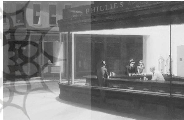
شکل ۱. شب‌زنده‌داران از ادوارد هاپر (اسلاتر، ۲۰۰۲: ۱۴۶)