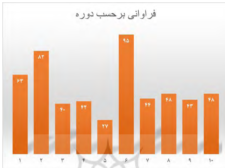
نمودار میله‌ای ۱: مغایرت با شرع بر حسب دوره

در راستای فراهم ساختن امکان مقایسه داده‌ها و درک رابطه شرع و قانون اساسی در نظم حقوق