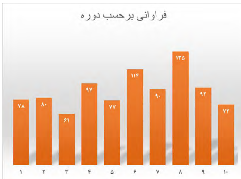
نمودار میله‌ای ۳: مغایرت با قانون اساسی بر حسب دوره