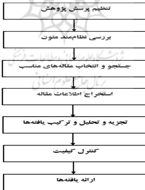
شکل ۱. مراحل هفت‌گانه فراترکیب (Sandlowski and Barço 2003)

بنابراین، فراترکیب مستلزم این است که پژوهشگر یک بازنگری دقیق و عمیق انجام داده و یافته‌های پژوهش‌های مرتبط را ترکیب کند. در این پژوهش از روش هفت-مرحله‌ای فراترکیب (Sandlowski and Barço 2003) استفاده شده است که مراحل آن در شکل ۱، نشان داده شده است.